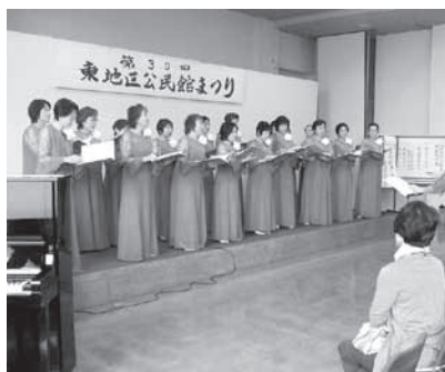
▲コーラスやダンスで会場は盛り上がります