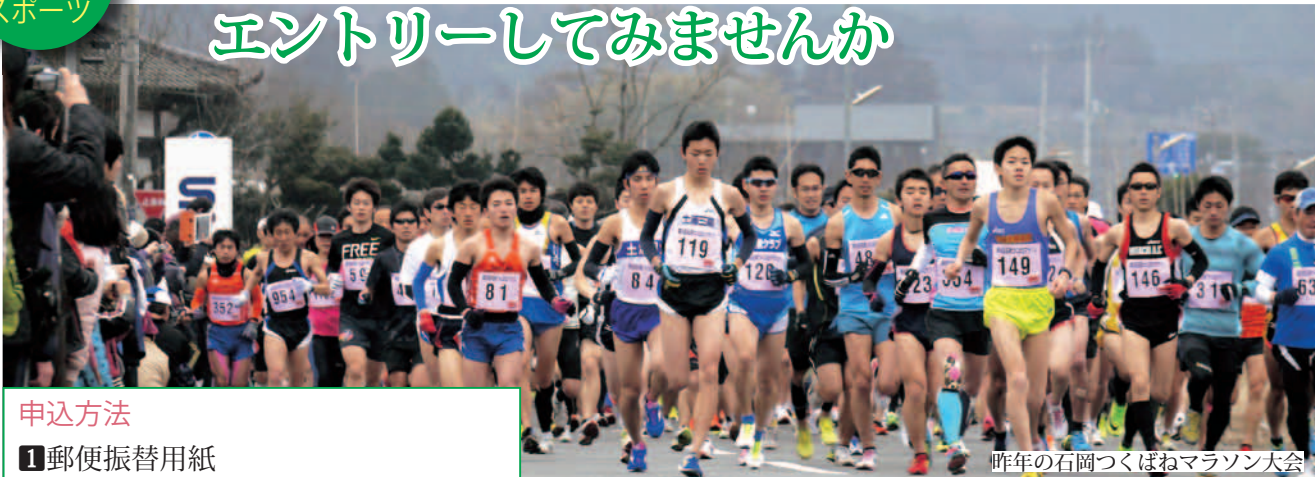
昨年の石岡つくばねマラソン大会