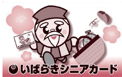
▲カードを持って元気に過ごしましょう