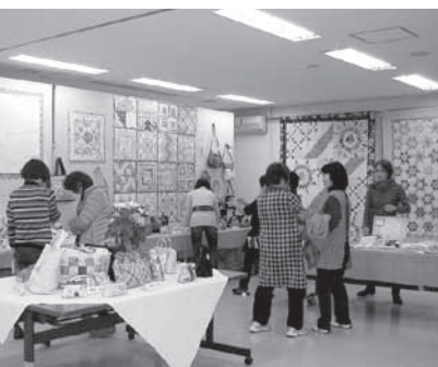
▲パッチワークやパンの花などの作品を展示します