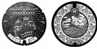
▲獅子頭や山百合などを用いた石岡市のマンホール