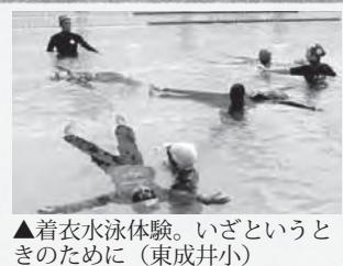
▲着衣水泳体験。いざというときのために（東成井小）