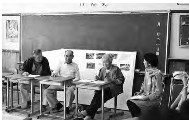
▲戦後70年、戦時中の八郷地区の暮らしを聞く企画も開催

ちよつと昔は当たり前であった、身の回りの物を自分でつくる暮らし。その技や知恵を見直し、これからの暮らしにつなげようと、10月18日、朝日里山学校を会場に八豊祭（やつほうまつり）が行われました。これは市内在住の若者を中心に始められたもので、今年で4年目を迎えます。当日は市内外から500人が来場。地元のお年寄りに薫ないを教わるなど、里山暮らしの魅力を感じられる企画が詰まったおまつりでした。