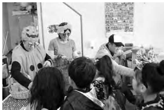
▲お菓子をもらうときは「ありがとう」と礼儀正しいお化けたち

10月31日、御幸通りや中町通りに、ハロウィンの仮装をした子どもたちの「お菓子くれなきゃいたずらするぞ」という元気いっぱいな声が響きました。 これは、まちが元気になる企画をするまちかど情報センターが行っているもので、6回目を迎えます。今年は過去最大級の150人が参加。参加店舗も30軒と年々増えています。子どもたちは90分かけて、まちなかの店舗を巡りました。