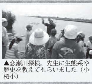
▲恋瀬川探検。先生に生態系や歴史を教えてくださいました（小桜小）