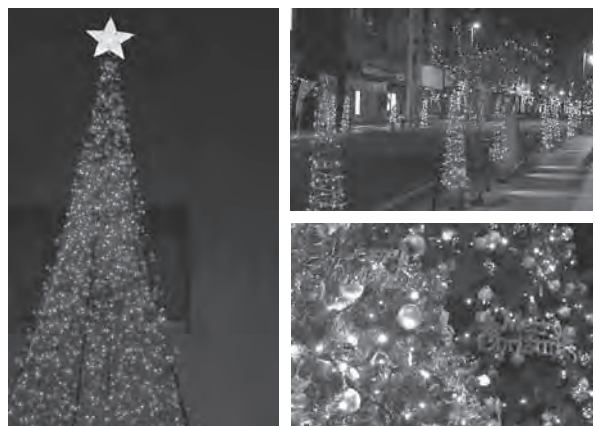
▲昨年のイルミネーション。石岡駅前大型ツリーイルミネーション(左)や御幸通り商店街のイルミネーション(右上)、まちかど情報センター前のクリスマスツリー(右下)

期間／平成28年1月10日(日)まで ※終了時期は変更になる場合があります。 時間／日没から午後10時頃まで(毎日)