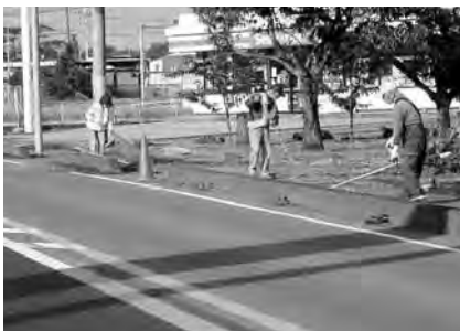
▲草刈り機の替え刃やガソリンの提供も受けられます

▼毎月第3土曜日に開くから3・土市（サンド市）。 日時／第3土曜日 午前11時～午後3時 場所／香丸・中町・御幸通りの参加店前、まちかど情報センター