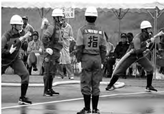
▲日々の練習の成果を発揮しました

10月11日、第66回茨城県消防ポンプ操法県南北部地区大会がつくば北部工業団地内緑地で開催されました。 石岡市からは、ポンプ車操法の部に市消防団第1分団、小型ポンプ操法の部に市消防団第15分団第4部が代表として出場しました。 結果は見事W優勝。各分団とも数か月前から厳しい練習の積み重ねが実を結びました。