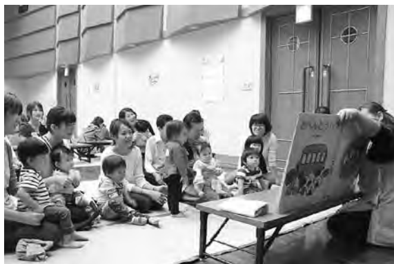
▲親子で楽しむ読み聞かせ

10月22日、ひまわりの館で合同お楽しみ会を開催しました。これは、子育てを楽しもうと、私立・公立保育園の地域子育て支援センターが合同で企画。60組の親子が折り紙や粘土、体操などをしながら楽しい時間を過ごしました。 参加した親子は「各センターの担当者も分かり、日ごろの子育ての悩みなどが相談しやすくなった」と今後も継続した開催を希望しました。