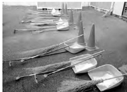
▲この制度に登録すると、清掃道具の提供を受けられます