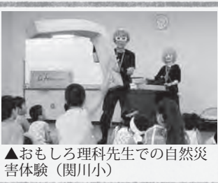
▲おもしろ理科先生での自然災害体験（関川小）