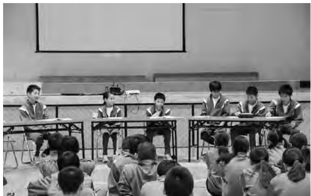
▲城南中で行われた平和・人権の集い

今年度から始まった石岡市中学生平和大使派遣事業の報告会が市内6中学校でそれぞれ開催されました。この事業は、各中学校の代表が広島市を訪れ、戦争の悲惨さや命の尊さについて学んだことを生徒たちに伝えるものです。 10月13日、城南中学校で行われた報告会では「先輩に原爆が落ちたことを話してもらい、戦争のことがよく分かった。そして命の大切さについて改めて感じた」と感想が寄せられました。