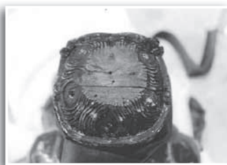
▲頭頂部の化仏取り付け痕

今回の仏像は、泰寧寺が石塚の地にあるときに作られ、現在の地にも移ってきたことが推測できます。城里町から石岡市へ―戦国時代の動乱を物語る資料と言えます。