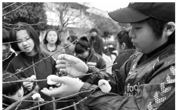
▲ならの木に紅白の餅を飾りつけました

無病息災や五穀豊穡を祈り小正月に行う「ならせ餅」。かつては家々で飾っていましたが、今では飾る家もだいぶ減りました。そこで1月17日、吉生小学校のスポーツ少年団やPTA関係者・地域住民の有志の皆さんが、子どもたちに地域の伝統行事を体験させようと、ならせ餅飾りを行いました。当日は子どもと大人が一緒になつての餅つき。直径5センチほどに丸め、一つひとつ丁寧にならの木に飾っていきました。