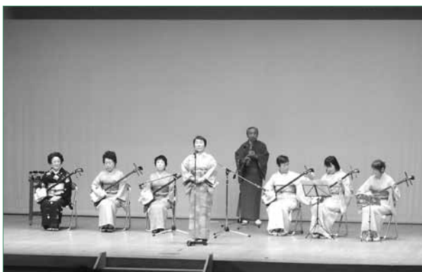
▲三味線の音色に合わせて民謡を披露しました

11月29日、中央公民館で八郷芸能祭が開催され、300人が来場しました。 これは八郷芸能祭実行委員会を中心となって行われているもので19回目を迎えます。 当日は、詩吟・民謡・舞踊の愛好者の皆さんにより、茨城県の民謡の磯節など、80演目が上演されました。 芸の道は一日にしてならず。訪れた人は、舞台上で披露される日ごろの稽古の成果を熱心に鑑賞していました。