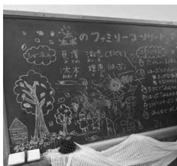
▲黒板でのプログラム案内

絵本や紙芝居の読み聞かせと、ハーブ演奏を行いました。朝日里山学校の木造建物の一室で行われたイベントには、小さなお子さんを連れた家族が多く参加し、子どもたちは手作りのマラカスでハーブと合奏したり、紙