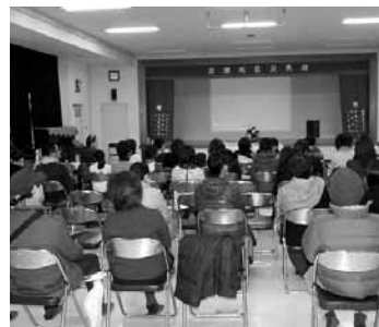
▲胎内記憶と子育ての実践、インナーチャイルドをテーマにしたドキュメンタリー映画に見入る参加者

「子どもの意思を受け止めて接すること、子どもが感情を出すことの大切さなど、子育てのヒントがたくさんもらえました」といった声が聞かれました。