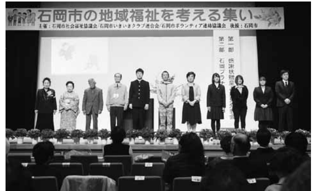
▲高校生から高齢者まで、それぞれの立場で意見発表が行われました

1月16日、石岡ふれあいの里ひまわりの館で「石岡市の地域福祉を考える集い」が開催されました。石岡市の高齢化率は29%と全国平均を上回り、人口の減少も進む一方。こうした課題に対して「地域に暮らす一人ひとりがどう向き合っていくか」を考えていくための初めての試みとして行われました。当日は600人が来場し、各世代の代表の皆さんの意見発表に耳を傾けました。