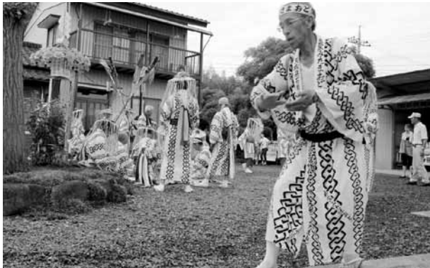
▲ 800年続くといわれる「真家みたまおどり」