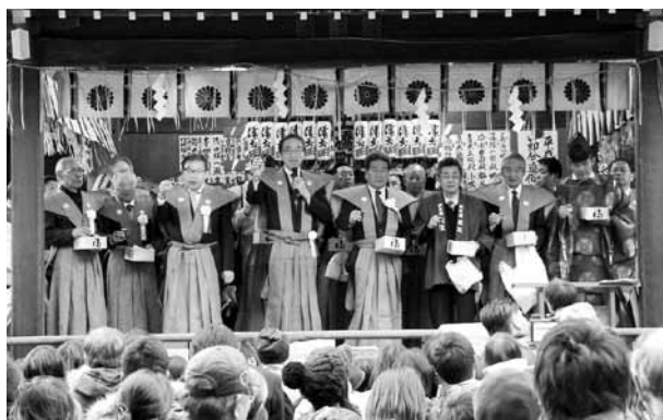
▲神楽殿の前で来場した皆さんと一斉乾杯

2月3日、常陸國總社宮の豆まき式に合わせて、境内にて「地酒で一斉乾杯！」の催しが行われました。「石岡の地酒で乾杯を推進する条例」が制定されて今年で2年。当日は、市内4歳の酒樽と酒瓶が展示され、各蔵の皆さんが地酒をPRしました。これから歓送迎会の季節がやってきます。秋に収穫した新米でこだわって造った味わい深い旬の酒を皆さんもご賞味ください。掛け声は「石岡の地酒で乾杯！」で。