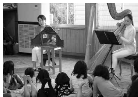
▲朗読とハーブによる「ジャックと豆の木」に聴き入る子どもたち

絵本や紙芝居の読み聞かせと、ハーブ演奏を行いました。朝日里山学校の木造建物の一室で行われたイベントには、小さなお子さんを連れた家族が多く参加し、子どもたちは手作りのマラカスでハーブと合奏したり、紙