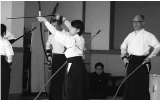
▲一矢一矢、精神を集中して射ます

12月6日、石岡運動公園体育館・石岡商業高等学校を会場に石岡市親善武道大会が行われました。この大会は、武道の発展と普及を目的に行われているもので、今年で16年目を迎えます。大会種目は弓道・剣道・柔道の三つで、小学生から一般まで計298人が参加しました。今年、一番多かった参加者の種目は柔道。日ごろの練習の成果を発揮しました。大会の結果は、市ホームページで公開しています。