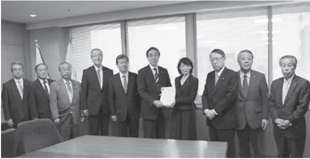
▲構成市町選出の丹羽雄哉衆議院議員とともに、丸川珠代環境大臣（写真左） 高木毅復興大臣（写真右）に要望書を提出