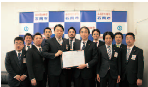
▲4月11日に協定を結んだ市長と石岡青年会議所の皆さん

市民の皆さんの様々な声を聴き、市政へ生かすため、石岡青年会議所と連携し、協働のまちづくり事業として「市民討議会」を予定しています。第4回の開催に向け、市と石岡青年会議所が実行委員会を組織し、協定を結びました。まちづくりのために、皆さんの力をお貸しください。