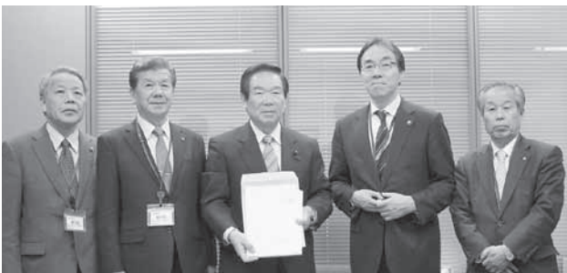
▲地元選出の額賀福志郎衆議院議員（写真中央）に要望書を提出