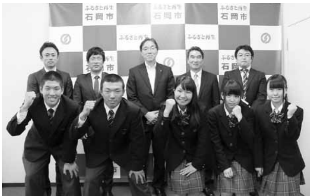
▲野球部（前列左）と弓道部（前列右）の皆さん

5月13日、石岡一高の野球部・弓道部の生徒たちが、関東大会出場への報告に市役所を訪れました。野球部は、春季関東高校野球県大会で準優勝し、弓道部は、関東大会県予選女子団体戦で優勝。素晴らしい成績で関東大会へと進みました。 同校では、ウエイトリフティング（重量挙げ）部、女子バドミントン部も関東大会出場を決めています。 高校生たちの今後の活躍が期待されます。