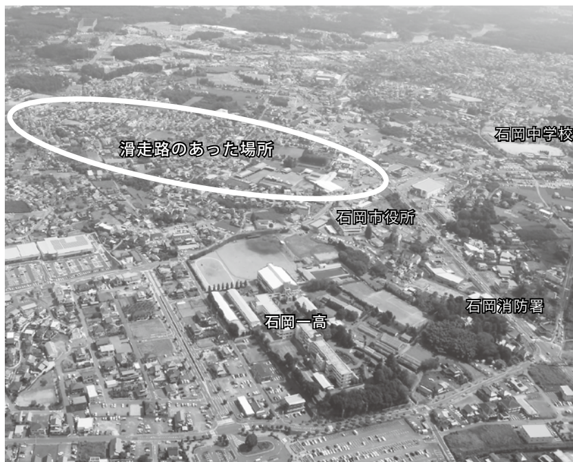
▲終戦から71年が経ち、昔石岡海軍航空基地や滑走路があった場所周辺も平和な日本のもとで大きく発展しました。

戦闘を経験したのは終戦の2か月前になります。6機の米軍機が近くの山を低空で飛行してきたところを、防空のため配備されていた高射砲で迎撃した事でした。砲弾が飛行する編隊近くでちょうど炸裂し、そのうち1機が火を噴いて海に墜落しました。しかし残りの5機が反撃に出て、駐屯していた4つの部隊目がけて一斉に攻撃してきました。皆さんな目に合いました。腹部貫通で即死するなど死傷者が出てしまいました。悲しむ余裕はない、と思うような時代でした。