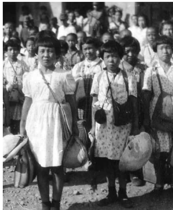
▲学童疎開で石岡駅に到着した東京都第四吾嬭国民学校の生徒たち（昭和19年8月）

にまちづくりや地域経済の話などを語る「火曜茶論」という講座がありました。そこで、私が親しいあるお医者さんに講師をお願いしたところ、医療の話ではなく、戦時中の体験を語り始めました。なぜ戦争の話をと、最初は驚きましたが、よくよく考えてみると、市民生活を最も台無しにするのは、戦争ではないかと。私の父は新聞記者で、戦時中の写真などを撮りためていたのですが、その写真を整理する中で、そうした思いを強くしました。