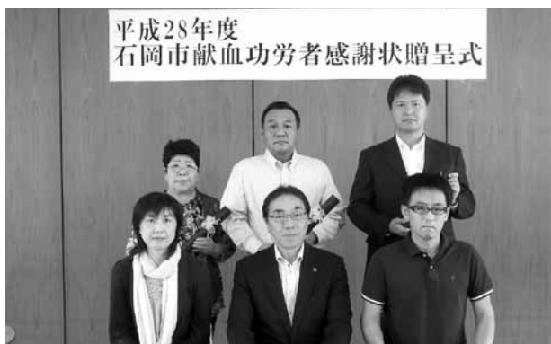
▲感謝状を受け取った皆さん

6月3日、石岡保健センターで平成28年度献血功労者感謝状贈呈式を行いました。 この感謝状は、これまでに50回以上の献血にご協力いただいた人が対象で「茨城県赤十字血液センター」から推薦を受けた9人に贈られました。 献血は水戸やつくばの献血ルームのほかに、市内ショッピングセンターなどを巡回している献血バスでも行えます。日程は広報紙の毎月15日号でお知らせしています。