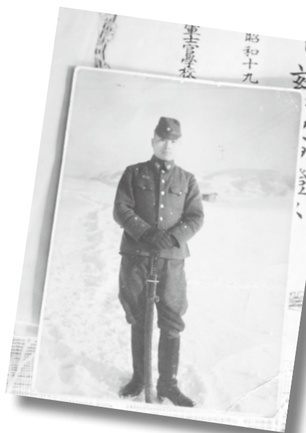
▲昭和19年雪が積もる手宮公園にて (北海道小樽市)

長く人生を経験して、現在の平和な世の中が素晴らしいことは言うまでもありません。大地震の状況は皆さんも