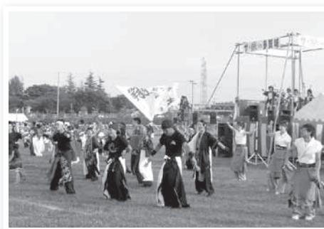
▲「ザ祭り in 多賀城」