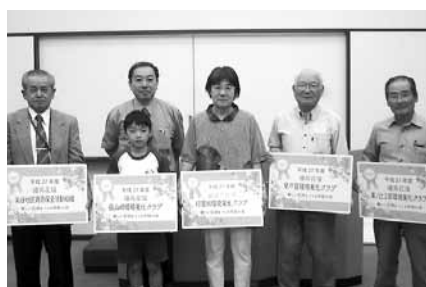
▲表彰式の様子。最優秀賞、優秀賞に なった5団体の皆さん