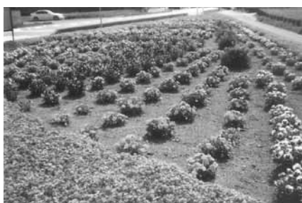
▲最優秀賞になった行里川環境美化ク ラブの花壇

歴史まちフリーカフェ ▼歴史をテーマにして、 自由にトークを楽しみま しょう。(予約不要) 日時/7月11日(月)・25 日(月) 午後1時～4時