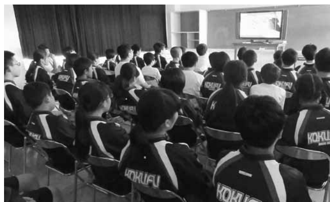
▲昨年度の活動から①平和公園での献花 ②被爆体験朗読会に参加 ③原爆ドーム見学 ④平和の子の像へ千羽鶴献納 ⑤灯ろう流しの様子