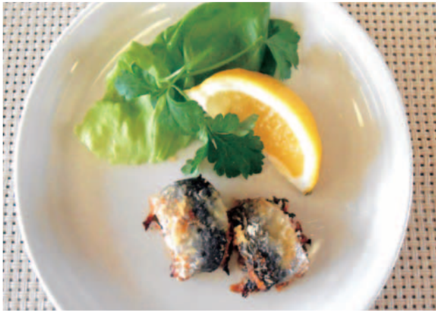
栄養成分(1人分) (エネルギー 198kcal、塩分 0.9g)

梅干しが苦手な人は、代わりにしょうが汁でいわしに下味をつけてからトマトに巻くのがおすすめです！