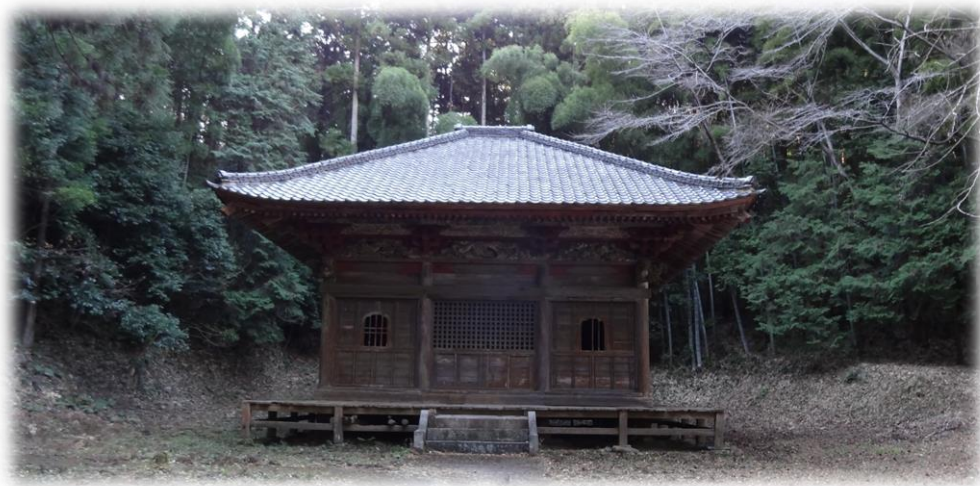
▲ 龍明地区にある長楽寺