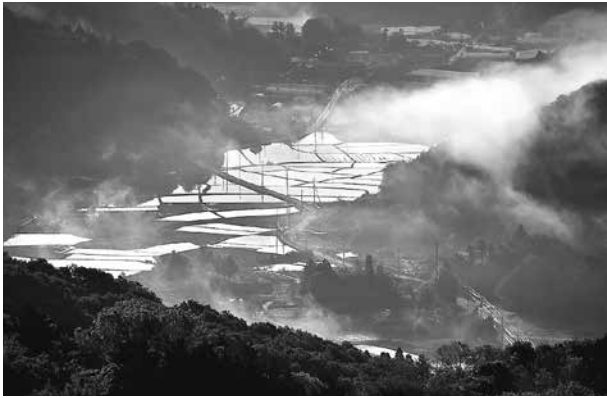
『小町花街道田植待つ』岡本祐彦氏 (H28 いしおかフォトコンテスト入賞作品)

石岡市の総面積は約 215 平方キロメートル。その約 8 割は農地・山林です。残りの 2 割である 40 平方キロメートルに 7 万人が暮らしています。市の人口密度は 1 平方キロメートル約 340 人（東京 23 区の人口密度は 1 万人以上）です。