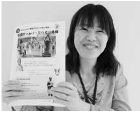
▲シルリハ体操会場をまとめた冊子ができました。包括支援センター、支所、本庁で配布中