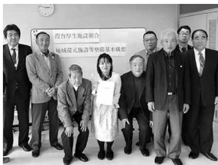
問 霞台厚生施設組合 建設計画課 Tel 56・7773