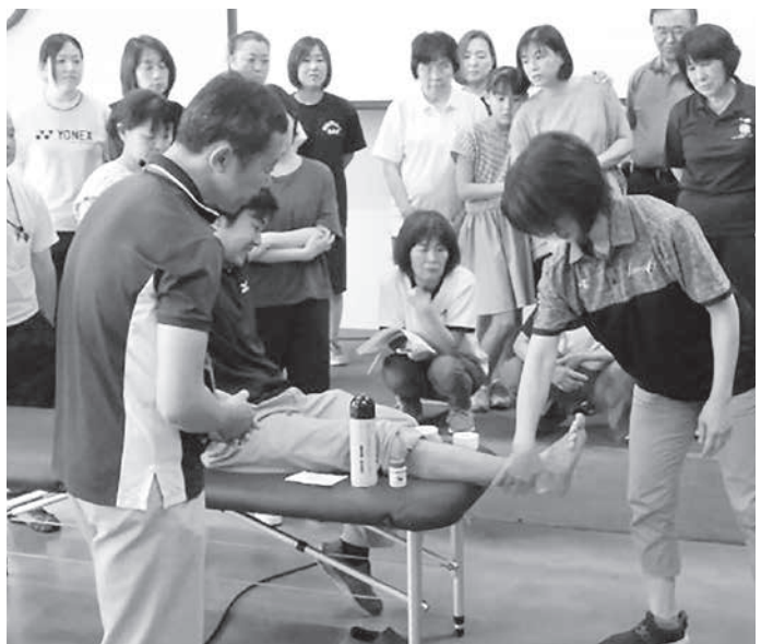
◆写真 / テーピング法実習を受ける参加者

当日は茨城県アスレティックトレーナー協議会代表の竹村 雅裕氏をはじめ4名の講師を招き、応急処置のテーピング講義やテーピング法実習が行われました。講習会には地域のスポーツ指導者37名が参加し、実際に参加者同士でテープ巻き指導を受けました。