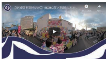
▲石岡のおまつり編