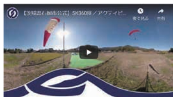
▲アクティビリティ編