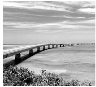
▲伊良部大橋（宮古島市）

▼10月25日から国内線運航ダイヤが改正され、神戸便・札幌便が1日2往復、福岡便・那覇便が1日1往復するほか、新たに宮古（下地島）への乗継便が設定されました。 茨城空港では、館内消毒の徹底、サーモグラフィによる検温の実施などの、感染症拡大防止対策に取り組んでいます。 最新の運航状況などについては、茨城空港ホームページをご覧ください。 茨城空港対策課 TEL 029・301・2761 茨城空港ホームページはこちらから▼