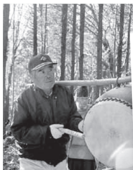
◀薬師古道を通ってお稲荷様へ。太鼓を鳴らし神主を先導します。

参加したお父さんからは「娘と料理したのは初めての経験、家でもやりたい」という感想をいただきました。巻き寿司づくりを通して、親子のコミュニケーションが深まりました。