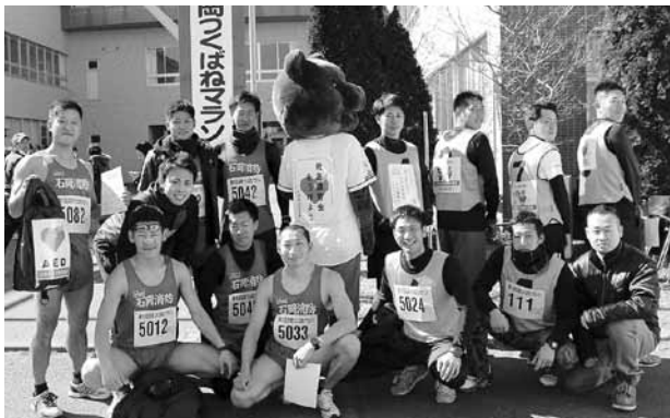
▲消防署員も「住宅用火災警報器」の設置を呼びかけながら完走

ランナーからは「筑波山が見えた、とても気持ちの良いコースだった。また来年も参加したい」という感想がきかれました。 消防署員も「住宅用火災警報器」の設置を呼びかけながら完走した。ランナーからは「筑波山が見えた、とても気持ちの良いコースだった。また来年も参加したい」という感想がきかれました。