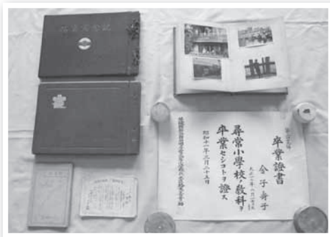
▲アルバムなどの貴重な記録資料