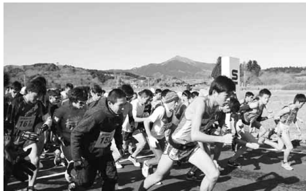
▲スタートとともに紫峰・筑波山を背に飛び出すランナーたち

早朝に雪が積もった2月19日、旧八郷南中学校を会場に第10回石岡つくばねマラソンが開催されました。 一般10km・5kmの部に937人、小中学生3km・2kmの部に951人、県外からは261人の参加がありました。 最初のスタートは10kmの部で、午前9時30分。この頃には、すっかり雪も溶けピストルの音を皮きりに走り出す足も軽やか。