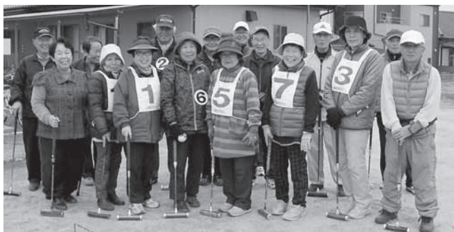
▲会って話せば元気になる。仲間同士が教え合う。そんな場づくりを進めています。