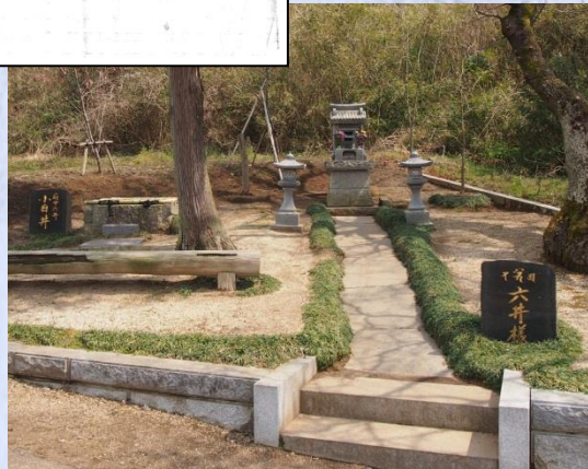
▼ 府中六井・小目井