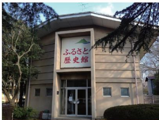
石岡市立ふるさと歴史館

開館時間 午前10時～午後4時30分 休館日 毎週月曜日 (祝日の場合は翌日) 交通 JR常磐線石岡駅西口より徒歩約12分 駐車場あり 住所 石岡市総社1-2-10 石岡小学校敷地内 電話 0299-23-2398