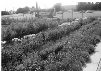
▲昨年受賞した東の辻二部環境美化クラブの花壇