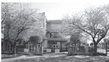
▲小川郷校跡 近代以降も小川小学校が置かれ、昨年度に閉校するまで多くの子弟が学んだ。

教育で作る新時代 期間/8月4日(日)まで 場所/ふるさと歴史館 (総社1・2・10) 休館日/月曜日(祝日の場合は翌日)