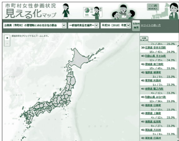
▲全国の市町村の女性参画状況が見えます