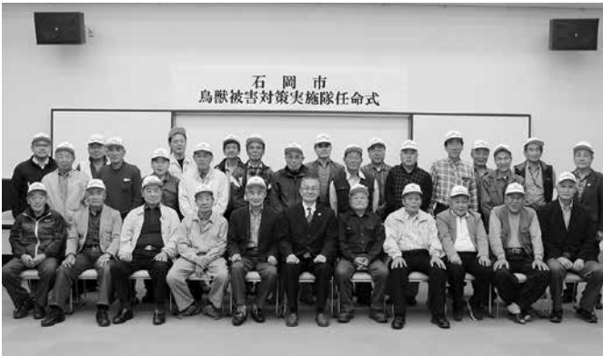
▲4月24日に支所で行われた有害鳥獣被害対策実施隊の任命式