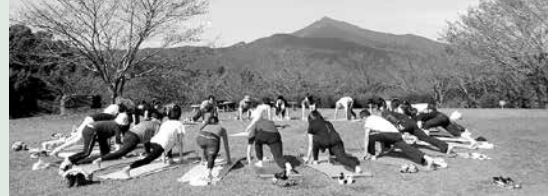
▲昨年の様子。会場は県フラワーパークの石岡市ふれあいの森・頂上芝生広場。(雨天時は頂上芝生の広場の休憩所で実施予定)。

地産地消のこだわりランチ (Yasato de トレタレストラン) でカラダの内側からキレイに♪