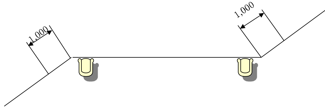
標準断面図(除草幅員) S=1/100