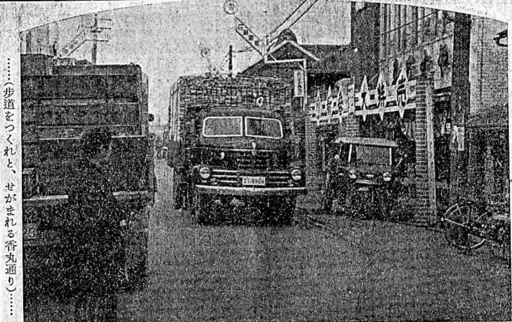
……(歩道をつくれと、せがまれる香丸通り)……

十五日は成人の日。新しい息吹が吹かされた。若人たちは、午前十時から市公民館に集り、市及び市教委会共催による成人の式典が行われた。市では、この日大人の仲間入りした六百八十人に対し、世論調査を行い、次のような回答が得られた。 成人の日を迎えての感想 ○うれしく感じた 5% ○責任の重さを感じた 80% ○親へ感謝の念 10% ○その他 5% 結婚について ○恋愛結婚がよい 30% ○見合結婚がよい 15% ○どちらでもよい 55% 青年に対する社会の批判に對しどう思うか ○きびし過ぎる 10% ○頭が古すぎる 10% ○無責任の批判だ 50% ○批判されてもやむを得ない 20% ○わからない 10% 就職状況 ○勤めている 男50% 女50% ○家事手伝い 男50% 女50% ○在学中 男50% 女50% ○何もしていない 男100% 女100% (就職したいが職がない)