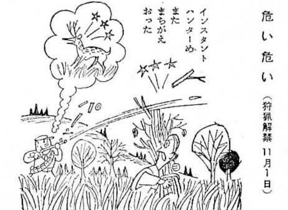
危い危い (狩猟解禁 11月1日)