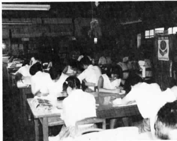
暑さにまけずに猛勉強 図書館は連日満員の盛況