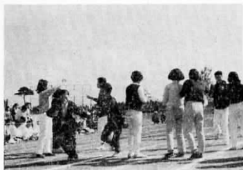
ワタシの彼氏は、どこかしら

からりと晴れわたった、11月3日の文化の日、石岡一高校庭で市民運動会が行なわれ、多数の市民が参加し、楽しい1日を過ごしました。写真は「恋人さがし」の一コマ。