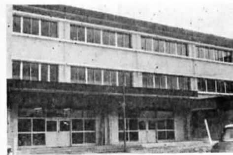
石岡小学校校舎（第二期工事）＝写真＝は鉄筋コンクリート造り三階建普通教室11などで、延面積1,067平方メートル、事業費2,750万円（一部は簡易生命保険積立金還元融資）となっています。

このプールは、長さ25メートル、巾15メートルで7コースになっており、更衣室など諸設備が完備している立派なものです。