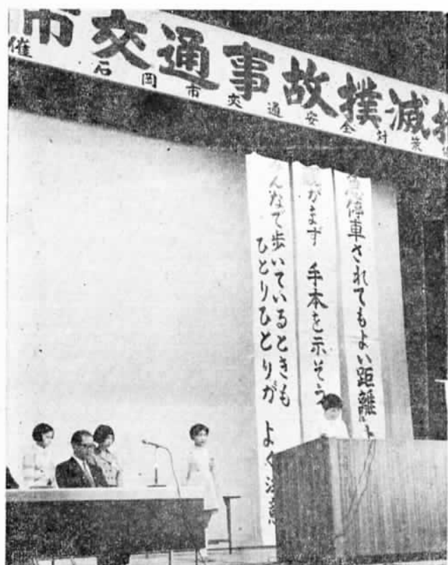
写真は規則を守って交通事故をなくしていこうと交通 トレーニングを受けての感想を発表する小学生たち

市交通安全対策協議会(会長大和田市長)の主催で、四月十二日に市民会館において、市民の皆さん多数が集まり、交通事故撲滅推進大会を開きました。 交通事故のない明るい社会と平和な文化生活への願いをこめて、この日集まった皆さんは事故撲滅について真剣に考え話し合いを行いました。この大会では、各関係諸団体の交通安全実践活動の報告と交通トレーニングを受けての小学生たちによる発表があったあと、「全市民の力を結集して、強力に交通事故防止活動をおし広め、地域、職域、 各家庭など市内のすみずみまで交通安全思想を浸透させ、徹底させて、交通事故による犠牲者をなくしていこう」と誓い合って散会しました。 なお、この大会において、日ごろ交通事故防止につくされた次の三名の方が表彰されました。