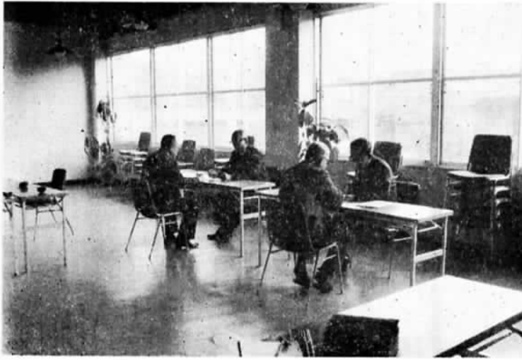
写真のように相談員は皆さんの相談ごとに対して親身になつて対応します。

もっとも多いのが土地に関する問題、次いで道路に関する苦情、家庭不和の問題、交通事故による補償問題などとなっています。 なかには、大に関係した相