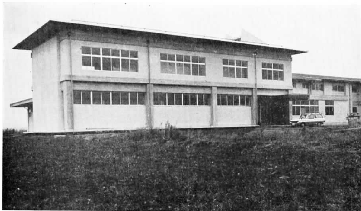
(写真は完成した営農研修センター)

毎月1回15日発行 昭和44年9月15日発行 (昭和44年6月9日) (第3種郵便物認可) (定価1部5円)