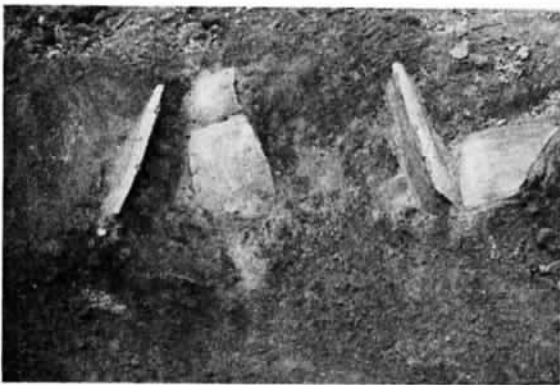
写真上 僧寺の発掘現場 写真下 発掘された「カマド」