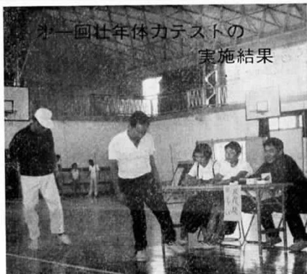
写真は反復横とびのテスト風景