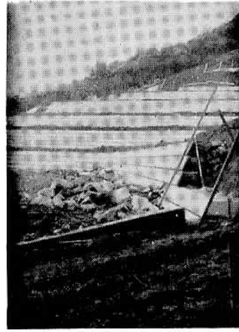
急ピッチで進む市営墓地の造成工事

にお墓のある人となない人と区別して、ない人を優先に考えてはどうか、その辺の問題、皆さんからも十分ご意見をいただいで、今後慎重に検討し