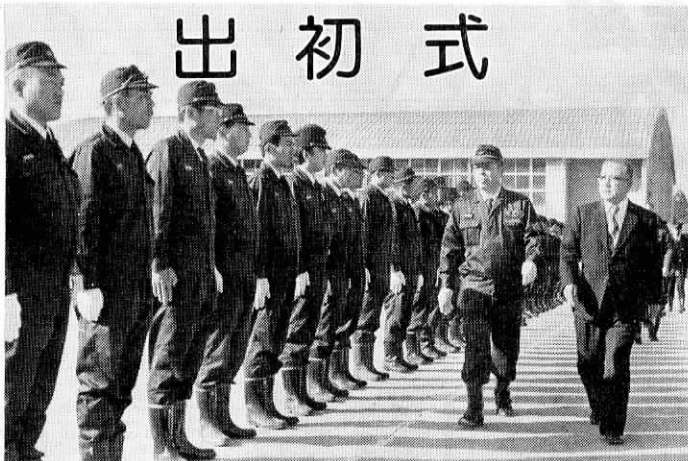
(写真は、出初式で点検を受ける団員)