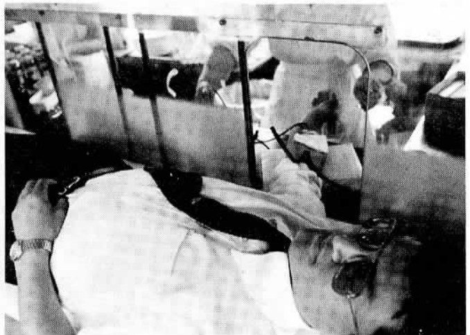
265名の市民のみなさんが献血

剤(血液成分製剤、血漿分画製剤)による治療へ移行しています。 この輸血方法は、現在、日本でも取り入れられつつあり、交通事故、労働災害の多発、輸血を要する疾病の増加などのほか、いろいろな要因とあいまって、ますます血液不足は目に見えているのが現状です。このようなときに県下でも初めてといわれる「一日赤十字」が市民のみなさんのご協力で開催され、しかも献血の目標を二〇〇名程度と予定していたところがこれをはるかに超える二六五名の方々が献血に協力されたことは、献血に対する認識と重要性が市民の