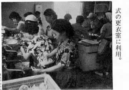
式の更衣室に利用。