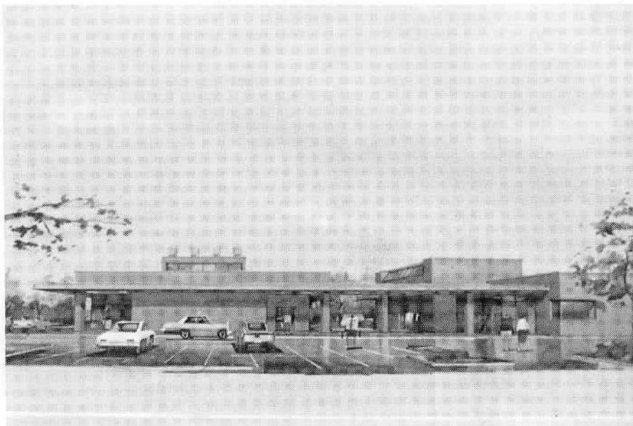
(石岡地方斎場完成予想図)

現在の市営火葬場(東ノ辻)の老朽化に伴い、石岡市を中心とする六市町村の共同で、新しい火葬場の建設準備を進めてきました。去る十二月二日、起工式が行われ、来年三月三十一日を完成目標に工事が始められました。 この事業は石岡市、八郷町、小川町、美野里町、千代田村、玉里村の六市町村で構成する一部事務組合石岡地方斎場(さいじょう)組合の手で、現在の石岡市営火葬場敷地を拡張し、総事業費約一億七千万円で、従来の火葬場とは全くイメージを異にした、明るく近代的な施設(石岡地方斎場)を建設するものです。 施設は、鉄筋コンクリート平屋建(六百七十三平方メートル)で、火葬炉棟と斎場会館にわけられ、火葬炉棟には、煙や臭気の出ない最新型の炉が三基設置され、煙突も従来のものとは異なり短煙突となります。 また、告別ホールや捨骨室、遺体安置室も設けられます。斎場会館には、待合室(和室十二帖)四室、待合ロビー、売店などの他、百二十人収容可能な葬式のできる斎場が配置されています。 なお、この工事は、現在の火葬場を従来どおり使用しながら実施します。