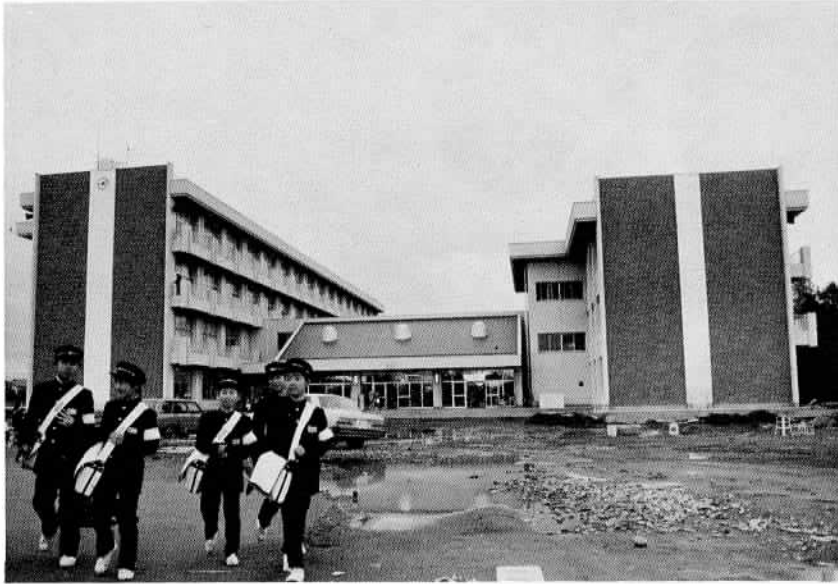
石中近代的な永久校舎が完成 新学期より授業を始めた 新しい校舎

石岡中学校の新校舎は、昨年の三月より工事を始め、建設費五億六千二百万円を投じ、今月末完成となります。新校舎は、現在の敷地に、鉄筋コンクリート二棟建てとなり普通教室二十四室、特別教室十一室（特別活動室一室、美術室一室、視聴覚室一室、図書室一室、教育相談室一室、音楽室二室、理科室二室、家庭科室一室）と教材置場の準備室八室、資料室四室、職員室、校長室、事務室、保健室、放送室、会議室を造り、建築面積五千六百五十八・六九平方メートルの近代的な校舎となりました。本校は、生徒数が年々増加し今年の四月には、新生二七五人、全体で九一九人（男子四四三人、女子四七六人）の生徒数となっております。