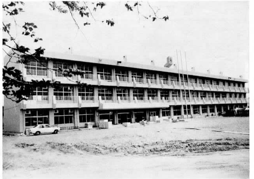
昭和8年に建られた高浜小旧校舎も解体され、高台にりっぱな校舎ができました

高浜小学校の新築校舎は、昨年の六月より工事を着手し、建設費三億四千万円を投じ、今月末完成の運びとなります。新校舎は、現在の敷地に鉄筋コンクリート一棟三階建てのものとして、普通教室十三室、図書室一室、音楽室一室、視聴覚室一室、家庭科室一室、理科室一室、図書室一室と、準備室が六室できるほか、職員室、校長室、放送室、保健室、資料室等、延床面積三千・七八平方メートルの近代的な永久校舎となりました。今春の新生は、四八八人、全体で三一九九人（男子一六八八人、女子一五一一人）の児童たちは、新学期より新校舎に移り、この運動場を一日も早く待ち望んでおります。