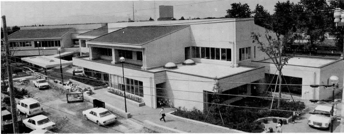
地域医療の拠点として完成した石岡メディカルセンター