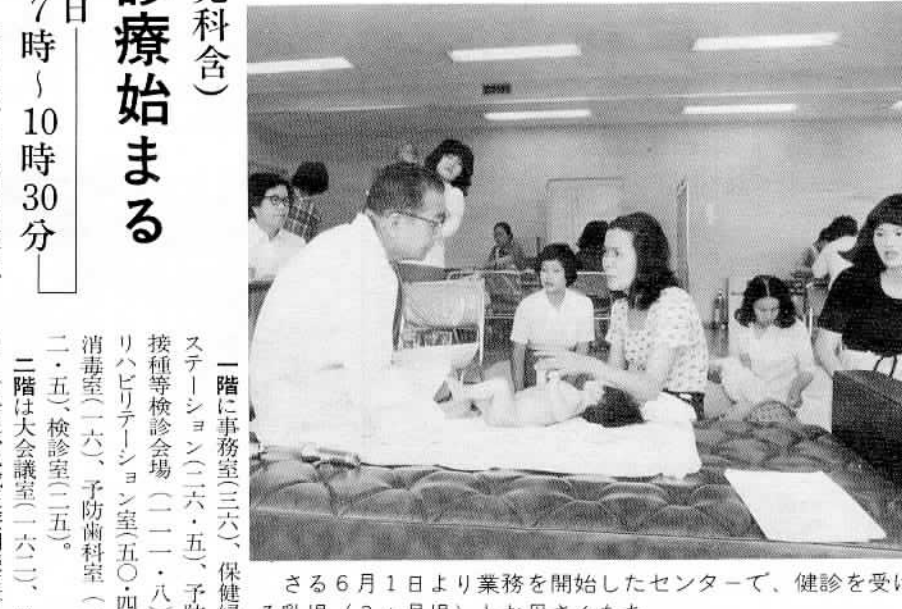
6月1日より業務を開始したセンターで、健診を受ける乳児(3カ月児)とお母さんたち。

従来からの業務 (市で行っていたもの) 母子対策として ○モシモシ赤ちゃん相談 ○三カ月、一歳半、三歳児健診 ○妊婦教室、家族計画、離乳食講習 成人病対策として ○成人病、婦人科がん検診 ○胃集団検診と結核検診 ○成人病食講習 その他 ○家庭訪問、各種予防接種 ○献血 ○休日緊急診療(六月三日より診療所をセンター内に移設)