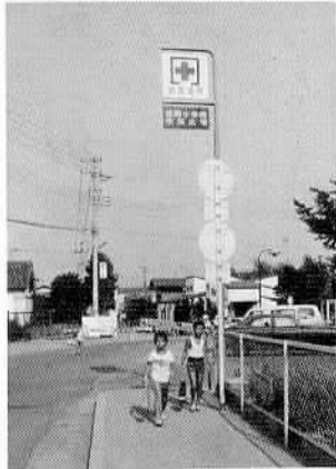
市内11カ所に標識柱を設置

また、おたがいに協力して情報伝達、消火活動、避難誘導、救助救護活動などができるよう町内、部落ぐるみの自主防災組織をつくらう。