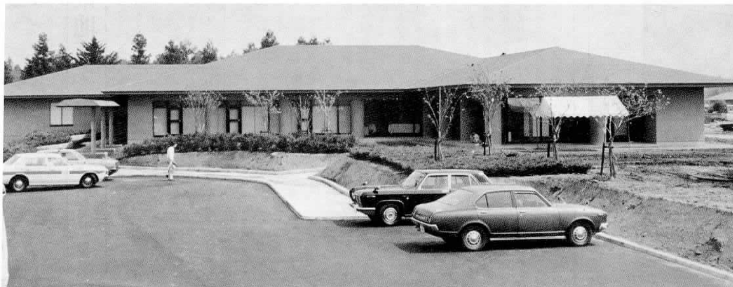
さる7月31日、関係者多数を招き竣工式が行われた高齢者福祉センター「白雲荘」