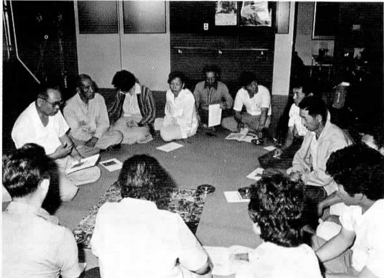
地区毎の説明会始まる (けやきの家にて水久保・出し山・行里川のみなさん)

排水施設をきちんとするためには「公共下水道事業」を進めなければなりません。下水道管を道路に埋めて整備するためあらかじめ道路がきちんとついでないと、放流先までのつながりが悪くなり、技術的にも、費