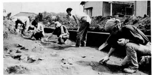
遺構確認のため茨城廃寺の発掘調査始まる(貝地東にて)

最近新聞で「茨城」の読み方その名義が話題になっているので、少しく考えてみよう。 最も古い記載を見ると、箱根の足柄山の坂より東は、すべて「我姫の国」と呼んでいた(常陸国風土記) 都から見れば、いまの関東・東北地方は遙か東の国であったからであろう。坂東の語もここから出たのである。 我姫の国の中には、いくつもの小さな国があった。本県のあたりには、茨城、新治、筑波、那賀(現在は那珂)、久慈、多珂(現在は多賀)の六つの国があった。(国造本紀)これが茨城の名の初見である。やがて大化の改新(六四五)の際、諸国は統合されて中央集権国家となった。その時常陸の国が誕生した。六国は分裂して十一都となった。すなわち茨城、行方、新治、白壁(真壁)、筑波、河内、信太、那賀、香島(鹿島)、久慈、多珂である。茨城の国から行方郡が独立した。 茨城郡というのは、いまの石岡市、玉里村、小川町、茨城町の一部、岩間町、美野里町、八郷町、千代田村の北半、出島村