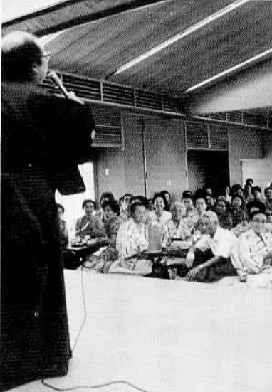
圏域内の一人暮らし老人を招き民謡教室が行われました。