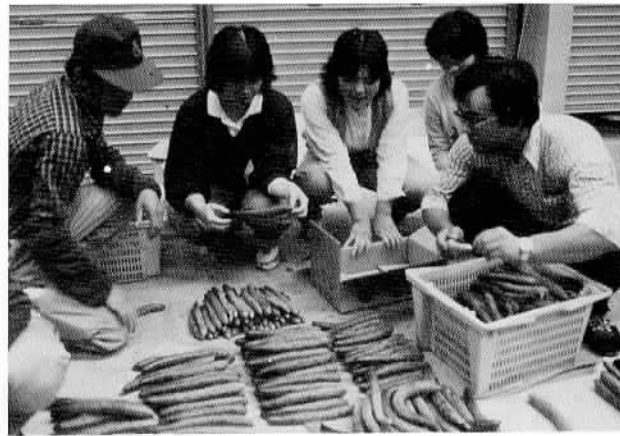
▲農業後継者に1日花嫁さん…… 市では、さきほど地域農業後継者対策事業の一環として、石岡ドレスメーカー専門学校の生徒17名の協力を得て、農家の生活を見ていただくため「一日花嫁さん」の行事を行い、関川の野菜ハウス内でキュウリの収穫作業を行いました。その後懇親会が行われましたが、その中で将来の伴侶が見つかったかも……。