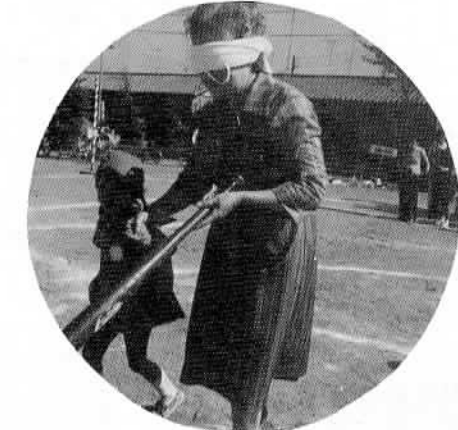
▲第1回児童館ファミリー運動会開く… さる10月21日、児童館の幼児・児童と地元の住民とによる、ユニークな運動会が90人の参加のもと行われ、地域住民（特にお年寄り）とのコミュニケーションの輪を広げる役割りを果たしました。