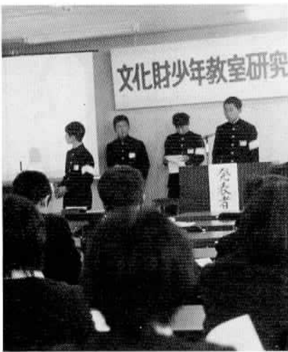
▲文化財少年教室発表会…… さる10月28日、商工会議所において、市内の中学校3校の文化財少年教室の学級生による、初めての研究発表会が行われました。学級生たちは過去をよく理解し文化財保護と郷土理解を深めたい…など力強い発表がなされました。