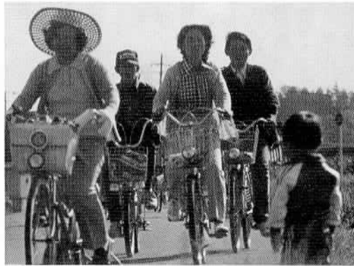
▲秋の一日をサイクリングで…… さる10月14日、恋瀬川サイクリングコースを利用して、市民秋季サイクリング大会が行われ、110名の参加者は八郷町の総合運動公園を見学し、楽しい一日をすごしました。