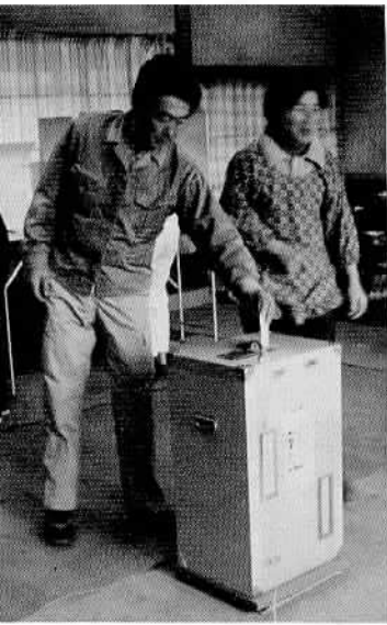
市議会議員選挙にて(第八投票所)

◆市内主要道路の 呼称決まる 今後永く残され、市民のみならずの生活の中に、とけこんで行くことを期待いたします。