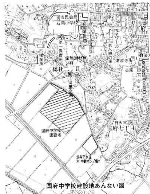
国府中学校建設地あんない図

この施設は、旧宮下町地先あんない図参照）に、三四、八三七平方メートルの敷地を確保し本年度は敷地造成工事を完了させ、校舎の建設に入り、五十八年度に完成させる計画です。校舎は、鉄筋コンクリート三階建二棟、延建築面積四、九八〇平方メートルとなり、A棟は普通教室十六室のほか、職員室、保健室、放送室、教室相談室、事務室等が設けられ二、七七〇平方メートルとなります。B棟は、特別教室棟となり、図書室、理科室、調理室、被服室、会議室、シンクロー及びL教室、音楽室、技術室、美術室等二、〇一六平方メートルとなります。また、A棟とB棟を結ぶ渡り廊下棟一九二平方メートルが設けられます。特に新設中学校は、生徒や先