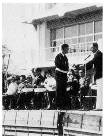
交通安全功労団体に感謝状を贈る