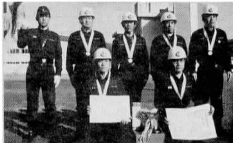
▲石岡第一分団郡大会に優勝 石岡・土浦・出島・八郷・千代田・新治・桜村、それぞれを代表する分団の自動車ポンプ操法を競い合う郡大会で、石岡第一分団が他6チームをおさえて見事第一位に輝きました。