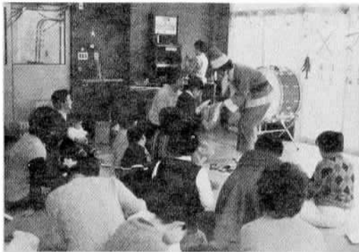
▲うれしいな、すてきなサンタのプレゼント 12月19日、5回目の「心身障害児クリスマスの集い」がげやきの家で行なわれました。ボランティアの学生が扮するサンタクロースが現われると子供達は大喜び。プレゼントのお礼に、みんなで唄や手品を披露しました。