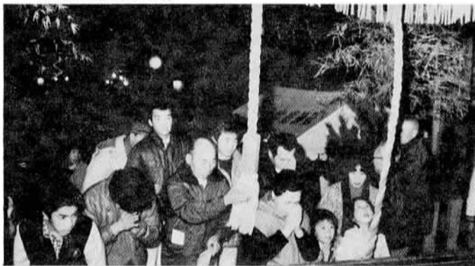
▲あたらしき夜に連なる初もうで（金刀比羅神社） 年が明けて午前1時近くになると、総社宮や金刀比羅神社には市内の人たちがぞくぞくと押し掛けてきます。今年も午前1時をピークに、それぞれ5,000人近くの初もうで客が訪れました。金刀比羅神社では「古札お焚き上げ」、総社宮では「炎上祭」とそれぞれ呼び方は違いますが、古いお札を一箇所に集めて焼き、圍に浮かぶ炎で参拝者は暖を取り、帰ってゆきます。