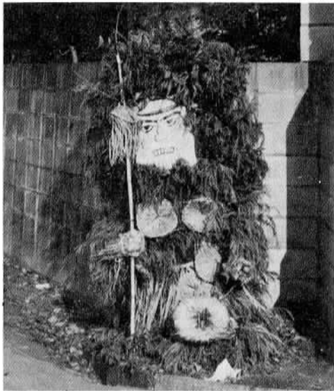
▲井関・代田のダイダラボッチ

井関より出島村に向かう県道が、大きくカーブして代田にさしかかるあたりに、不可思議な人形がぼつんと立っている。葉と杉の葉で出来たその人形は、刀を腰にさし錫杖のようなものを右手に携えている。はちまきをした顔は、天をにらんで勇ましく下へ突き出した陽物が妙にユーモラスな印象を与えている。