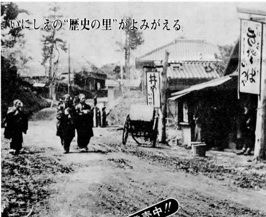
いにしへの“歴史の里”がよみがえる。