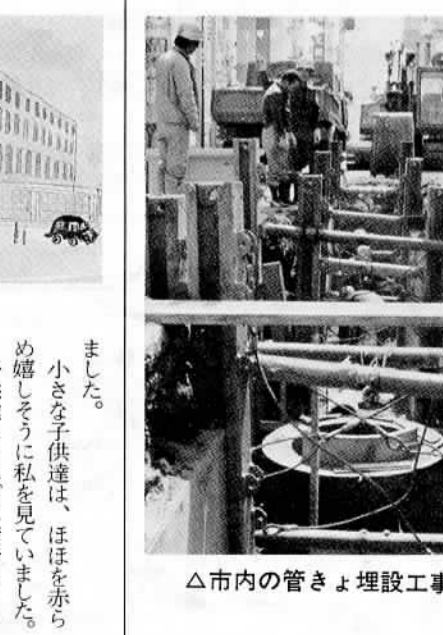
△市内の管きょ埋設工事

特定事業場と一般事業場 人の健康・生活環境に被害を及ぼす恐れのある物質や廃液を排出する施設を特定施設といいます。（水質汚濁防止法に定められた業種で約二五〇種類の施設が特定施設） この特定施設を有する事業場を特定事業場とします。 一般の事業場と特定事業場では、手続き・規制・罰則などで違いがあり、特定事業場はより厳しい規制となります。 以上、三回にわたり公共下水道について説明して来ましたが、この趣旨をよく理解してトイレの水洗化に御協力をお願いいたします。