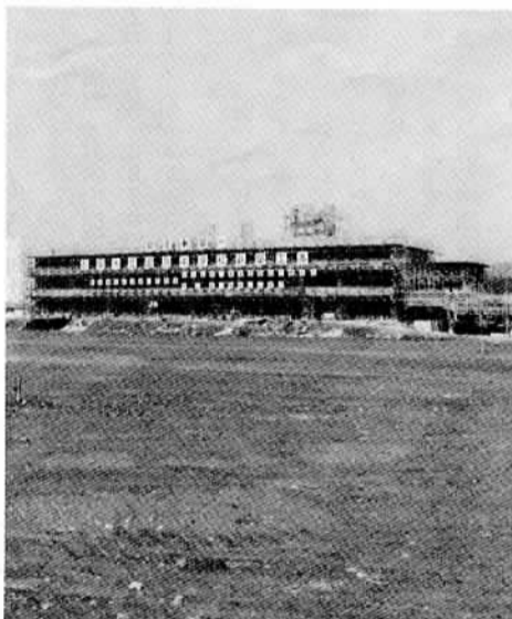
△昭和59年4月開校を目指す国府中学校

「歴史の里」は、特性ある地域 「歴史の里」づくり 「歴史の里」は、特性ある地域 今後は、科学博開催までに行う事業とそれ以後の長期的な事業とに整理し実現して行きます。