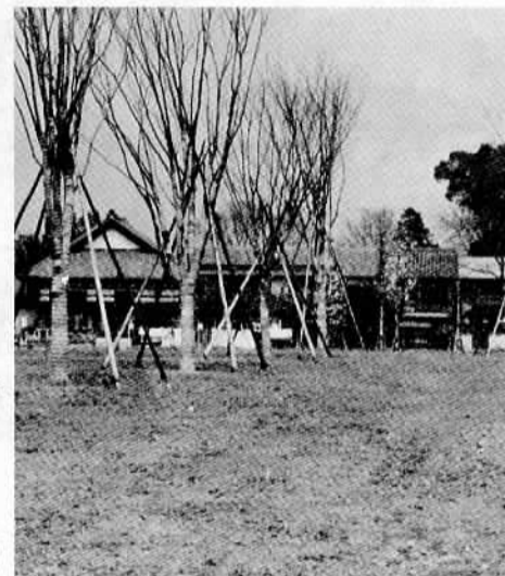
△けやきに囲まれたやすらぎのある国府公園の完成も間近です