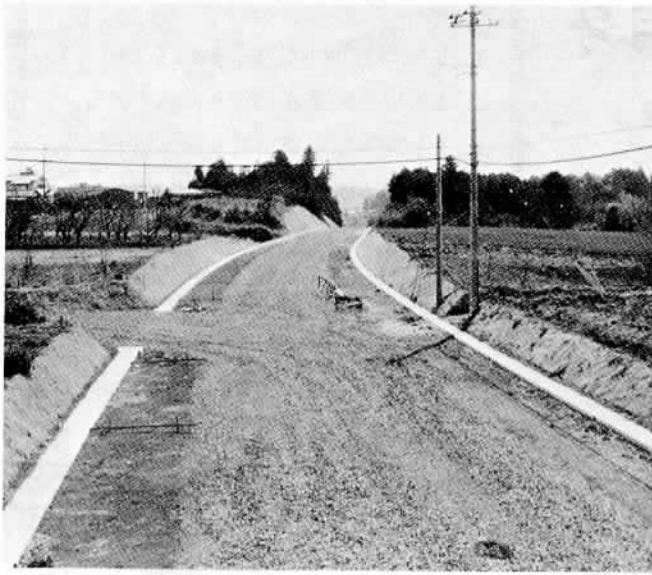
△第4年次の事業がすすむ高浜本線15号

ますます需用が増えていく生活用水や工業用水を安定して供給するために、湖北水道企業団では、第4次の拡張事業に取組んでいます。 この工事の完成後の水源については、地下水の有限性に対処