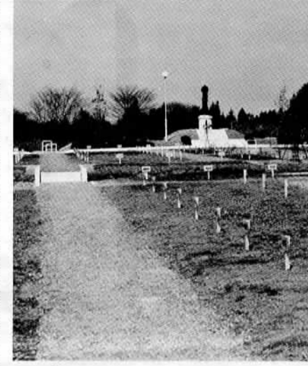
△高さ2.4メートルの聖観音像を配した半ノ木霊園が完成

活力ある都市づくり 市産業の振興と総合観光都市構想 農林・畜産の振興 農業の発展については、地域農業の組織化と農業経営の近代化を目標として、将来の農業の担い手の確保と育成に努めます。松くい虫の被害を受けた森林に対しては、苗木のあつ旋を行ない森林の緑を守って行きます。畜産については、飼育技術の向上と優良品種の導入に力を入れ、畜産環境の整備事業を進めます。 商工観光の振興 商業の振興については、商工会議所の事業活動の一層の助長に努め、商業行事の充実・商店街共同事業の奨励・制度金融と利子補給など、一連の計画を行います。 すでに事業化されている香丸通りの歩道は、完成に向けて引き続きその促進に努めます。また、市内にある工業に適合した未開発地については、将来に備えて開発の方針でそのプランを進めて行きます。 市の観光は、石岡のお祭り・高浜のつりが代表的なものです。総合性が著しく不足している現状です。このため、歴史の里づくりを一つの発端として健康な観光レクリエーション都市づくりを目指します。