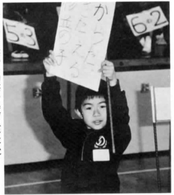
▶ゲラゲラ笑った初笑い集会(杉並小) 1月25日、杉並小学校の体育館で初笑い集会が開かれました。「ケンケン相撲」や「神経衰弱」「仮装大会」などがクラス対抗で行われ、珍プレーの続出でみんなゲラゲラ初笑いです。

1月17日関川小学校の校庭に、全校児童が参列してハレーすい星観測記念歌碑の除幕式が行われました。これは昨年暮れ、石岡ハレーを見る会とNTT石岡電報電話局が、同校を会場に催した「ハレーフェスティバル」を開き、その際市長が詠んだ「星空にロマンを求め学童ら冬の寒さに胸燃やしている」の和歌が刻み込まれています。