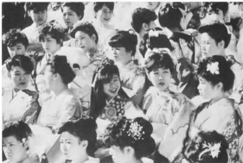
▲式典終了後、出身中学校ごとに集まって記念撮影。居並ぶどの顔も嬉しさに満ちていました。

一生に一度しか出席することのない成人式。市民記者の取材とはいえ、何とも嬉しい気分です。遠い昔の私自身の成人式。そして、あと数年後には我が子も出席すると思うと、人一倍の関心が湧いてきます。 式典の会場・市民会館は、華やいた雰囲気の中にも、厳肅な空気が張り詰めていました。