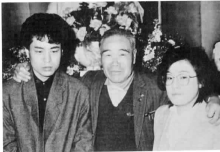
▼鬼がいっぱい! 豆まき集会(南小)

怒りん坊・朝寝坊・勉強ぎらいの鬼など様々な鬼に扮装した5年生が、全校児童に豆をぶつけられた豆まき集会。終始なごやかな雰囲気でした。