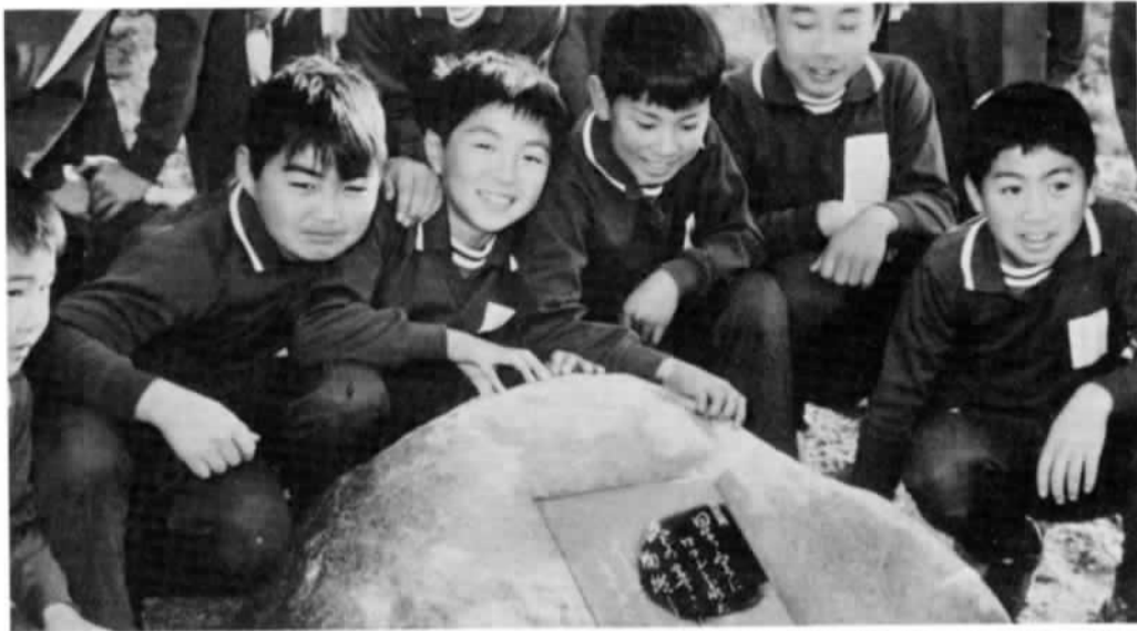
▲ハレーすい星観測記念の歌碑がNTT石岡電報電話局よりプレゼント(関川小)

1月17日関川小学校の校庭に、全校児童が参列してハレーすい星観測記念歌碑の除幕式が行われました。これは昨年暮れ、石岡ハレーを見る会とNTT石岡電報電話局が、同校を会場に催した「ハレーフェスティバル」を開き、その際市長が詠んだ「星空にロマンを求め学童ら冬の寒さに胸燃やしている」の和歌が刻み込まれています。