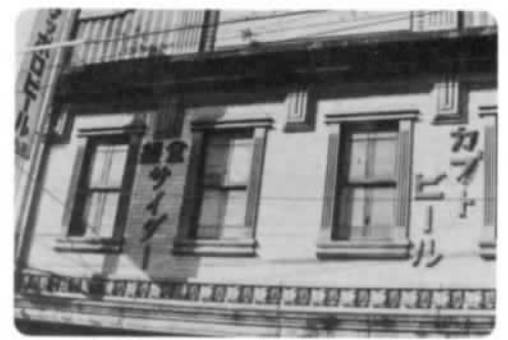
石岡の民家 ⑬ 白菊支店 (国府3-4)