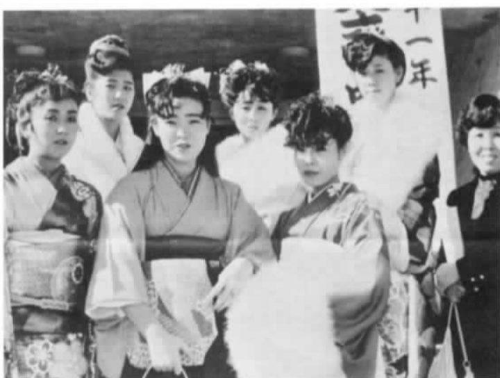
▲今年の石岡市の新成人は712名。式典への参加者は542名で76%の出席率でした。

写真撮影終了後は、解散。そのまま、それぞれに帰宅する。何か物足りない雰囲気。いつまでもこの会場を立ち去りたい気分が感じられました。 勿論、家庭では祝うのでしようが、もう少し主催者側としても、何か心に残る催し物がしてあげられたら、と考えてしまいました。 それというのも、近い将来我が家の二人の子供が出席して、長い人生の中でこの成人式をどれ程心にとどめてくれるだろうか、と疑問に思ったのです。 例えば、中学校別の記念撮影の後、学校単位で恩師などを招待してちよっとしたパーティをもつたり……。主催者側としては大変でしょうが、市の未来を担っている新成人のために一苦労するのでも悪くはないのでは