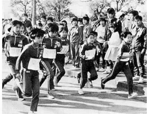
▲寒さなんか平気とばかり力強い走りを見せるチビッ子ランナー。

市教育委員会・市体育協会・石岡AC主催による第二十四回石岡AC(アスレチッククラブ)マラソン大会が一月十五日、柏原工業団地内のコースで行われました。この大会には、市内の小中学生を始め近隣町村の一般の人を含め総勢七百五十人が参加し、前回を二百人も上回る大盛況。