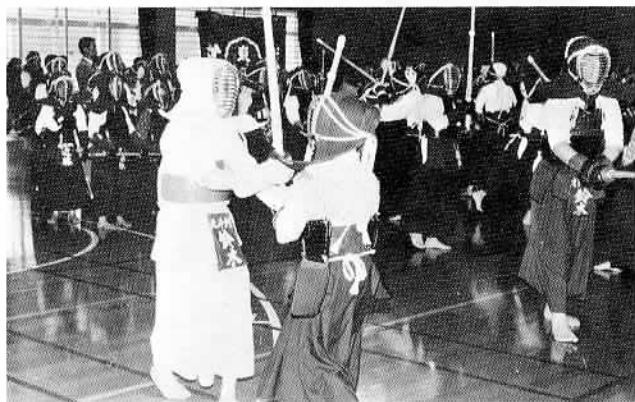
▲“オメン、ドー”館内には子供たちの元気な声が響き渡りました。

豆剣士たちは、熱き声援を背に受けて闘志あふれる好試合を展開しましたが、中には接戦の末、負けたくやしきから館内の片隅で泣きじゃくる子も。この大会の勝利を目指し、日頃厳しい練習に励んでいた豆剣士たち、本当にご苦労様でした。成績は次の通りです。