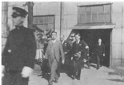
▲昭和21年11月19日、石岡のアルコール工場を御視察する陛下のご一行。背後に見えるMPという文字から、終戦直後の緊迫した空気が感じ取れます。