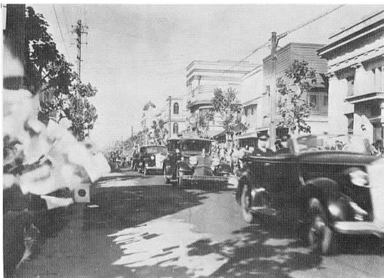
▲市内の中町通りを土浦方面に向かう車の列。沿道は小旗を持つ人であふれ、プラタナスとモダンな家並が目を引きまします。

昭和二十一年十一月十九日、人間宣言のあった天皇陛下が戦後の復興視察を目的に、我が石岡にも立ち寄られました。石岡への行幸は、昭和四年の陸軍特別大演習に続き二度目。