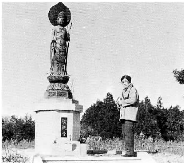
▲昭和58年の4月から売り出された市営半ノ木霊園の高台には、高さ2.4メートルの聖観音像が安置されています。

溝をまたいで数歩進めば肩の山。花・空きビン・竹筒などお盆には異臭と小虫が飛び交います。