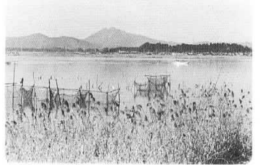
石岡の風景 ② 高浜入江からの筑波山