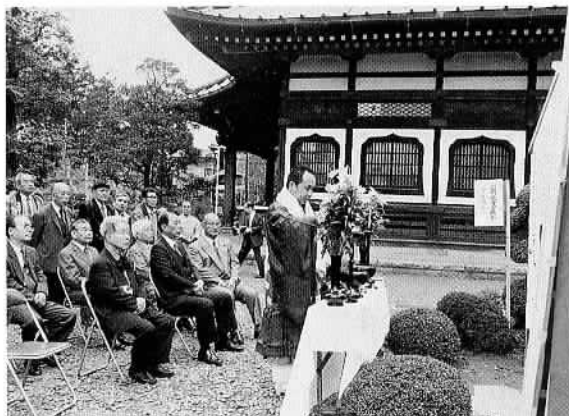
▲盛大に扇歌堂の修復落成式(四月八日) 都々一坊扇歌をまつる扇歌堂の修復落成式が、約七十名の関係者が出席して園分寺境内で行われました。昭和初期に建立された扇歌堂の老朽化が進み、二月から三月にかけて修復されたものです。