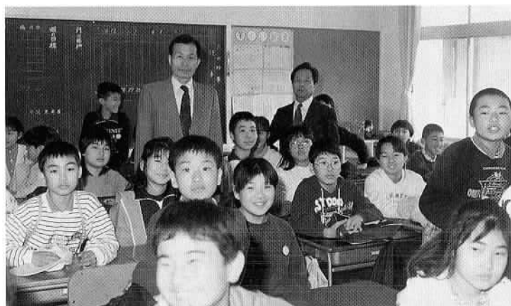
▲石小に韓国からのお客さま(4月6日) 石岡小学校に姉妹校(韓国ソウル特別市昌信国民学校)から図画と絵はがきを手に2人のお客さまがきました。石小と昌信国民学校は、昭和48年から毎年図画、習字、絵はがきの交換をして友好を深めています。

▶新刊紹介「常陸総社宮例大祭と獅子」 「常陸総社宮例大祭と獅子」は、土橋獅子保存会が町内に残る記録や写真をもとに編集したものです。A4版・本文十九ページ、写真十九ページのこの本は、一部千円です。詳しくは、川崎秀明 ☎(03)5538。