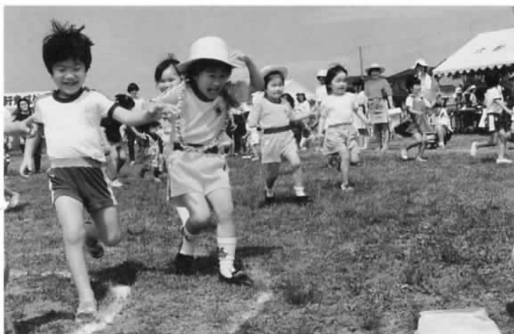
▲六軒東区体育祭に4百名が参加（5月20日）

幼稚園児からお年寄りまで町内会全員が参加して、六軒東区体育祭が、「高喜の広場」で行われました。玉手箱、ホールインワン、長縄跳びなど、みんなでハッスルしました。