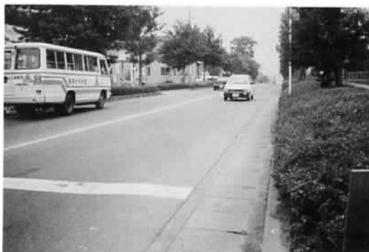
▲石岡の風景③ 深緑の杉並通り