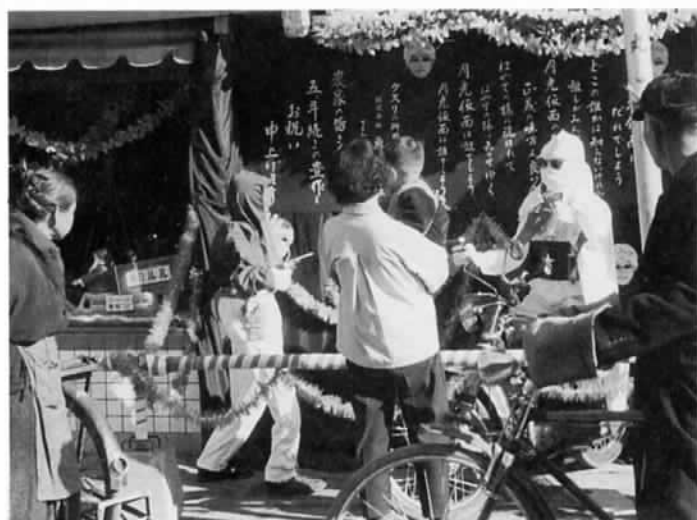
▲香丸町の街角にあらわれた月光仮面。昭和30年ごろに行われた案山子コンクールの一コマです。

昭和三十年ごろに行われた案山子コンクールの日の一幕です。当時の国民的人気者・月光仮面が、香丸町のとある菓