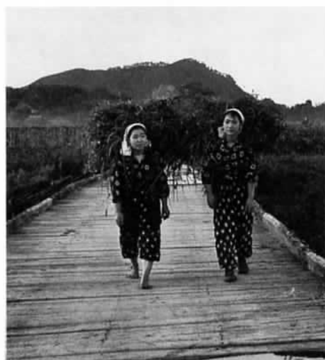
▲草を背負って栗田橋を渡るモンベ姿の女性2人。昭和30年代初期の風景です。

木造の栗田橋を渡る二人のモンベ姿の女性。背負った草の背後には、龍神山のなだらかな山