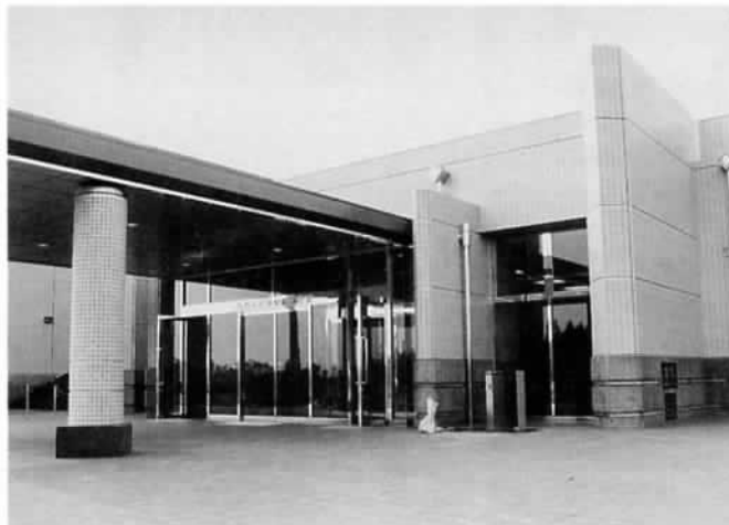
▲周辺の整備も急ピッチで進み、完成間近かの運動公園体育館

市運動公園体育館のオープンを記念し、男子バレーボールの招待試合を行います。 ■日時 8月16日 午前11時入場予定 午後1時試合開始予定 ■会場 市運動公園体育館 (東田中、商業高校南側) ■申し込み 官製ハガキに、(住所、氏名、年齢、電話番号を明記)「バレーボール観戦希望」と書いて、7月28日