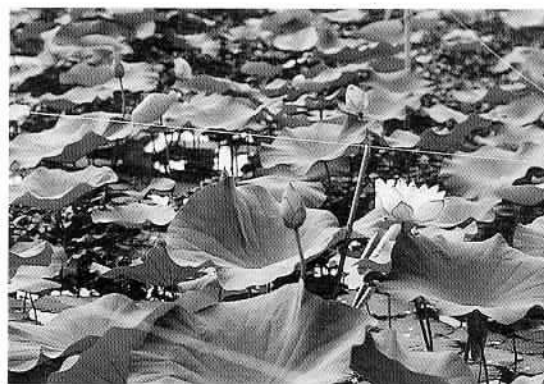
▲石岡の風景⑧常陸風土記の丘に咲く縄文ハス