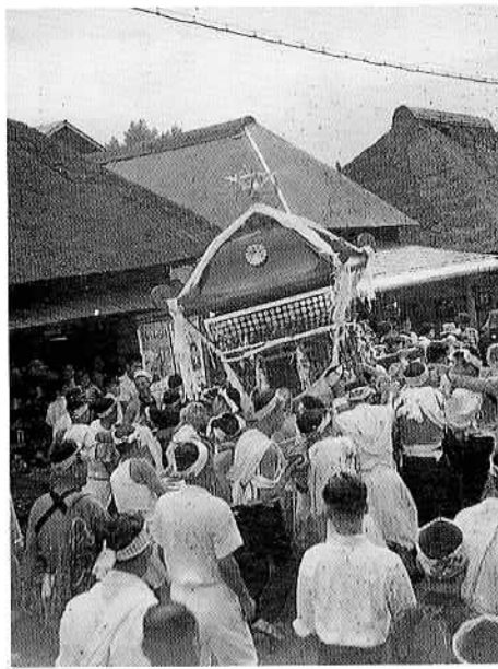
▲土橋通りを巡行する常陸総社宮の神輿

昭和三十二年九月号の「市報いしおか」に山車・獅子舞コンクールの結果が載っています。山車部門は大小路町、獅子部門は土橋町でそれぞれ優勝旗を授与されています。上の写真は、昭和三十年ごろの土橋通りを巡行する常陸総社