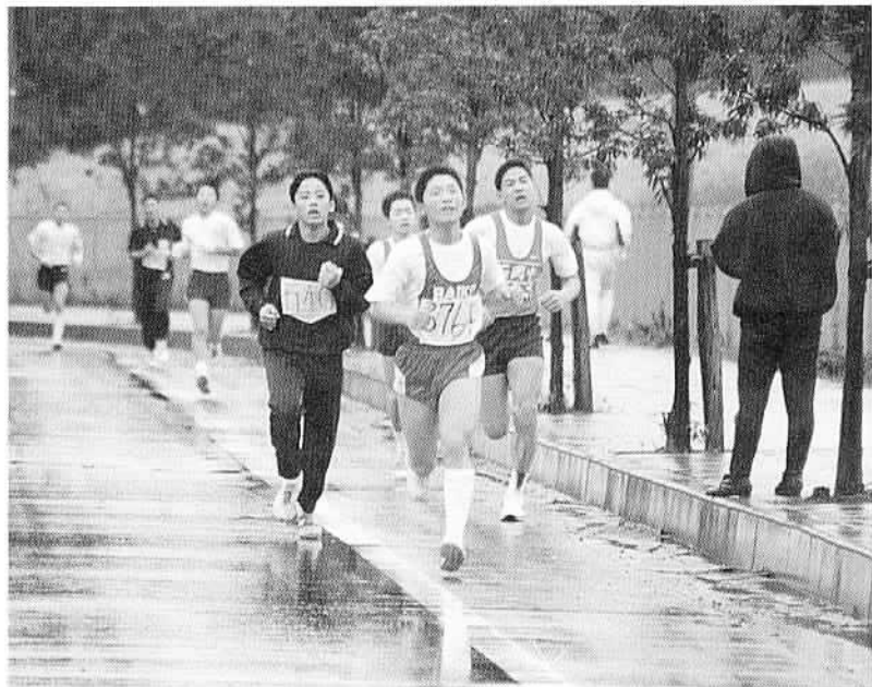
▶寒さを振り切つてラストスパート。

一月十五日、第二十九回石岡ACC(アスレチッククラブ)マラソン大会が、南台団地内コースで行われました。三百五十八人の参加者は、多くの声援と冷たい小雨の中記録を伸ばしました。