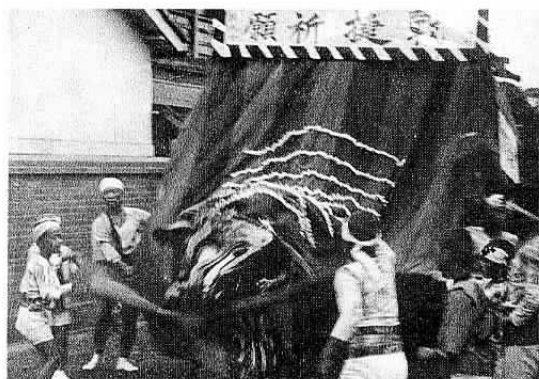
▲武運長久を祈願する土橋町の獅子(昭和13年)。

新聞とラジオには、日本軍の報道され、国民の興奮は次第に高まっていきました。万歳万歳の祝賀旅行列は全国各地で行われ、石岡も同様に歓喜の空気に包まれました。