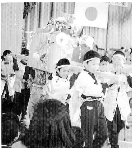
▶三村小の新体育館で学年発表（十一月五日）

石岡駅前警察官派出所が新しくオープン。石岡駅西口周辺整備事業として、今まで駅の南側にあった派出所を、北側（泉橋側）に移転したものです。建物は鉄筋コンクリート2階建て、面積は約95平方メートル。市民が気軽に困り事相談などができるコミュニティールームも新しく設けられました。