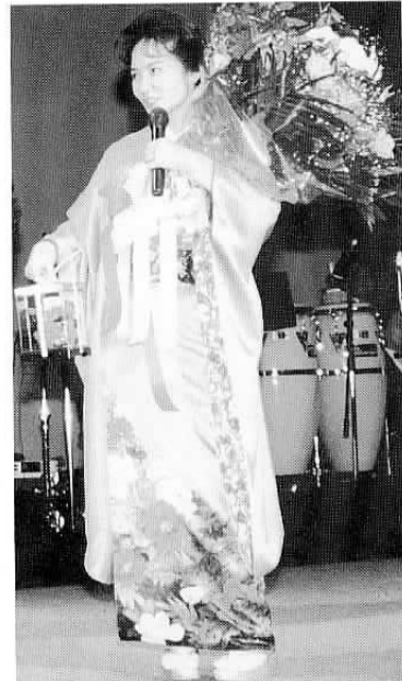
▲市民会館で「香西かおりシヨ」(十二月十八日) 石岡市民会館大ホールで「香西かおりシヨ」(市民会館自主事業)が盛大に開かれました。午後一時六時の「ステージ」が行われ、会場は約千五百人の観客で超満員。素晴らしい歌と素敵なお話しに、楽しい一時を過ごしました。