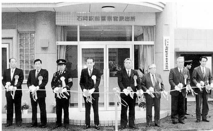
▲駅前派出所が新築移転（12月20日）

石岡駅前警察官派出所が新しくオープン。石岡駅西口周辺整備事業として、今まで駅の南側にあった派出所を、北側（泉橋側）に移転したものです。建物は鉄筋コンクリート2階建て、面積は約95平方メートル。市民が気軽に困り事相談などができるコミュニティールームも新しく設けられました。