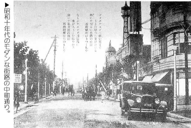
昭和十年代のモダンな街路の中町通り。