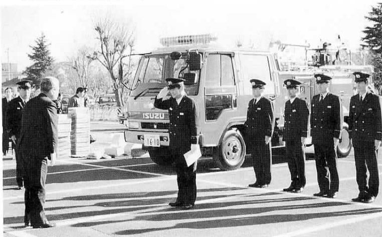
▲化学消防自動車を配置(12月22日) 柏原出張所に、新型の化学消防自動車が入りました。この化学消防車は、いすゞフォワードの196馬力・ジーゼルエンジンで、1,300リットルの水タンクと500リットルの薬液タンクを装備。柏原工業団地を控えた北部地区の消防に威力を発揮します。