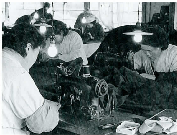
▲裸電球の下で、縫製作業をする授産所の女性たち。