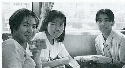
◀車内での楽しいひととき。

東京ディズニーランドは、“夢と魔法の王国”。楽しい乗り物やディズニーの愉快的仲間たちが、皆さんのお出でを待っています。