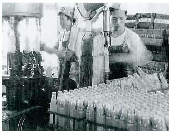
▲筑波乳業の轆しのコーヒー牛乳。