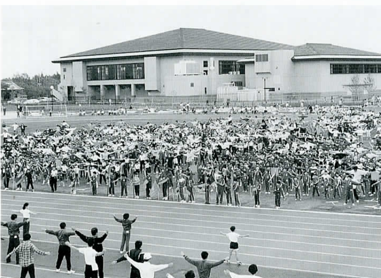
▲5月5日、市運動公園陸上競技場で行われた子ども会スポーツの集い。準備運動の風景です。

石子連のあり方、指導力がますます問われる時だと思えます。また子ども会活動には、YSC（高校生会）活動の重要性、必要性も欠く事はずりません。楽しい子ども会作りには石岡市民みんなを取り組めばと願わずにはられません。 どもの街宣言」を読み上げました。文面の関係で、全部を紹介できないのが残念ですが、その時の一部であるおとなの