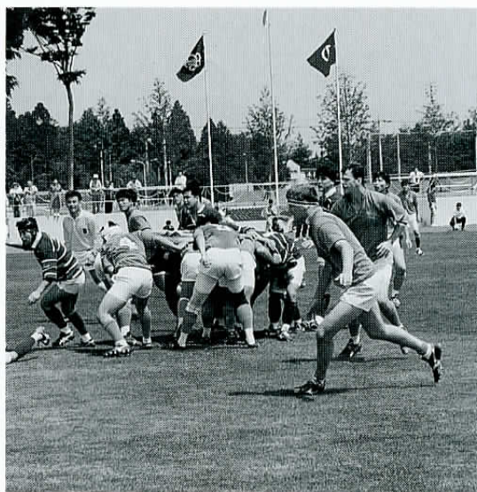
▲5月22日、陸上競技場で行われた市制40周年記念事業ラグビー大会。

※詳しくは、市運動公園体育館へ。 ☎(26) 7 2 1 0 7月15日(金)以降は、市民プール管理事務所へ。 ☎(24) 0 0 7 6