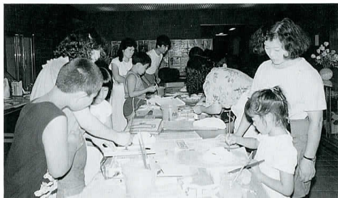
▲親子で楽しい工作 / (昨年の城南地区公民館の夏休み教室)。