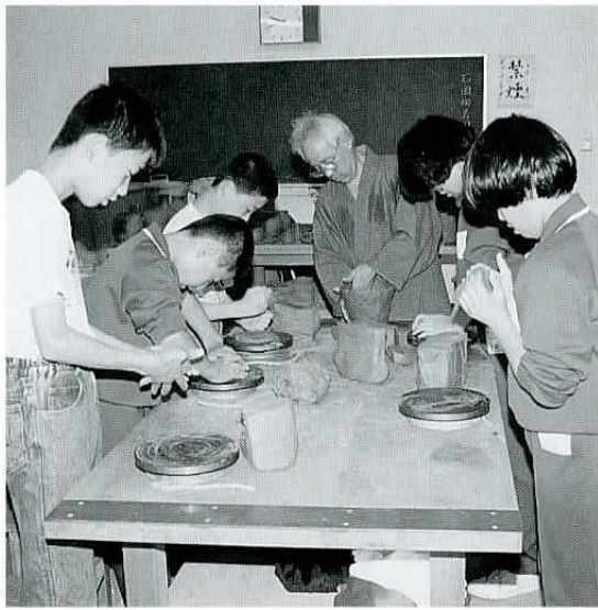
▲昨年の7月、東地区公民館で行われた文化財少年教室(土器づくり)。