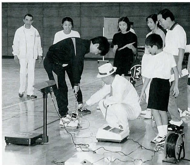
▲10月10日(体育の日)、市運動公園で行われた市民体カテスト(背筋力測定)。