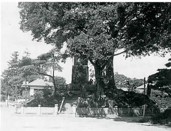
▶戦後、奉安殿跡には、水道タンクが作られました。