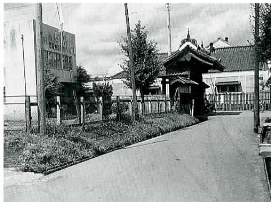
▲陣屋門と酒蔵と公民館（昭和40年代）。

発掘調査の結果は、ここ数年目覚ましいものがあります。藤木古墳、吉野ヶ里遺跡、青森の丸山三内遺跡の調査から、古墳時代の美、耶馬台国への手掛かり、東北の古代王国の存在など、次第に古代世界が浮き彫りになっていきます。