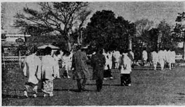
成年式典を終え、名実共に成人として、重なる意義は、国政に参与する能力を得る事、憲法第十五条第三項は「公務員の選挙については、成年者による普通選挙を保障する」と定めており、これに基づいて、公職選挙法は、満二十歳に達した者には、衆議院議員、