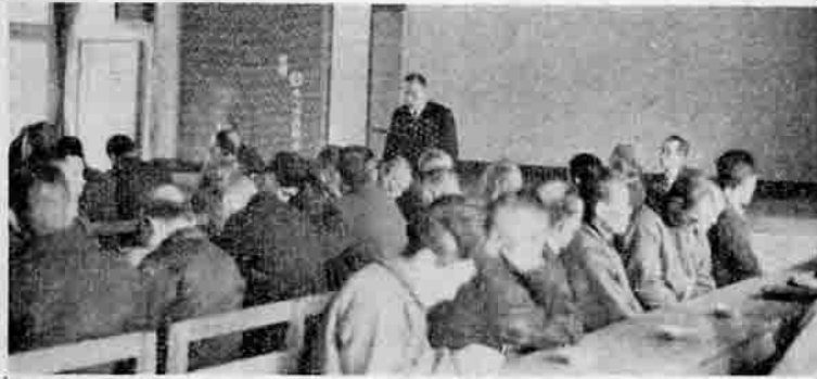
区長会ひらく 昭和36年度の町区長会は、2月26日午後1時30分から公民館でひらき、町長が新年度予算編成の基本方針などを説明し、続いて議長の見解があり、質疑応答が活発に行なわれ、盛会のうちに午後4時近く散会した。