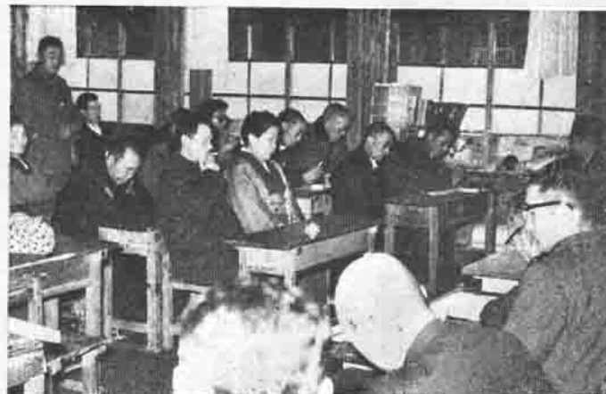
「助言者を囲んで活発な話し合ひ」恋瀬中学校で

地域における共通問題を解決するための社会教育研究集會が各地区で開かれていますが、恋瀬地区の研究集會では農業後継者の問題について、とくに活発な意見の交換があった。