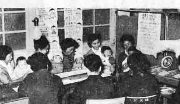
(熱心に赤ちゃんの相談をする人々—八郷公民館で—)

新しく始められた赤ちゃん健康相談所も利用者が非常に多く、五月七日の戸聴、林地区の相談日には二三名が相談を受けています。