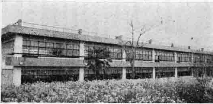
お目見えした近代的な校舎

統合柿岡中学校の第1期工事が終り、普通教室などが完成しました。昨年12月に着工以来、工事も順調に進み、総工費2,984万円、鉄筋コンクリート2階建、総坪1,312平方(397坪)、普通教室13、便所、その他ができてきました。10日には、関係者81名を招き、第1期工事完成までのあらましについて報告会を開き、新しい校舎をみてもらいました。引き続き第2期工事として、本年度は総工費3,475万5千円の予算で、普通教室、図書室、美術室などを作る予定です。