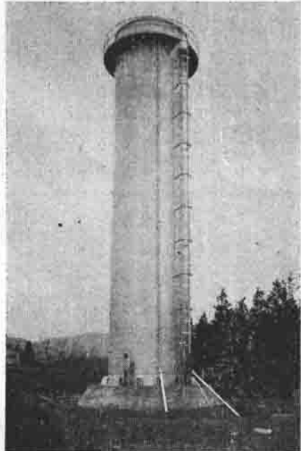
(写真は完成した配水塔)

柿岡地区簡易水道の第一期工事である本工事（配水塔、深井戸など）も完了したので、引き続き第二期工事の流末工事（各家庭への配管工事など）について、五月十二日、日本水道KKと五百十六