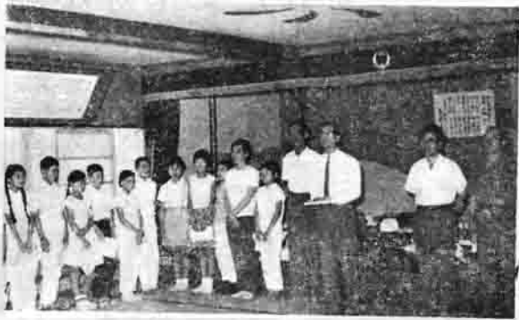
(子ども会の講習会であいさつをのべる町長)