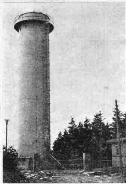
(ここから各家庭へ給水される)