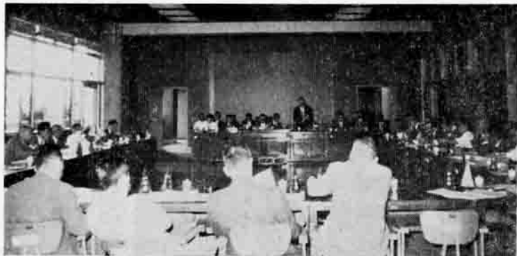
(議案の提案理由を説明する町長)

農業労働力調整協議会なくなる 昭和三十六年五月に発足した農業労働力調整協議会も、