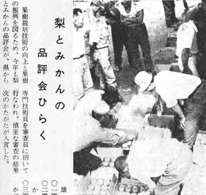
梨とみかんの品評会ひらく 果樹栽培技術の向上と果樹の振興を図るため、今年も梨とみかんの品評会が、県から

たばこ 養蚕 お互いに約束かわす たばこ養蚕は、町における重要な産業です。ご承知のとおり、両業は相反する産業です。