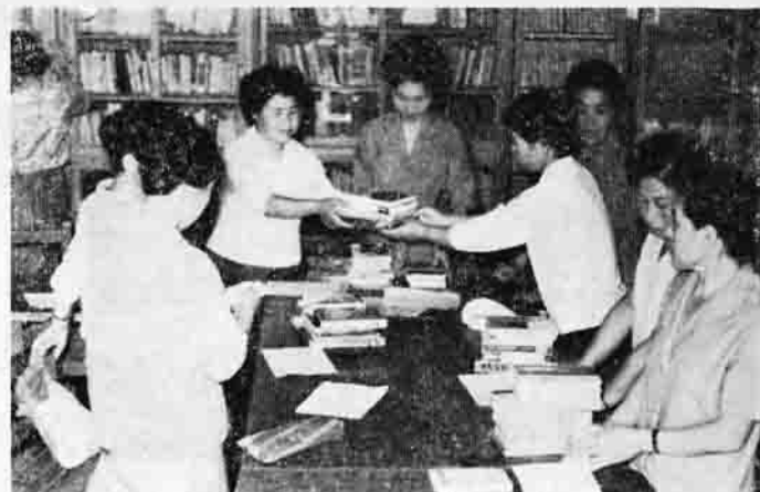
本の整理をする小桜小PTA 母親文庫のお母さんたち

「みのりの秋」そして「読書の秋」がやってきました。10月27日から二週間は「読書週間」です。この機会に少しでも本を読む習慣をつけましょう。町には19の読書会があって、かっぱづな読書活動を行なっていますが、読書会に入っていない方のために「本が借りられる施設」をお知らせします。